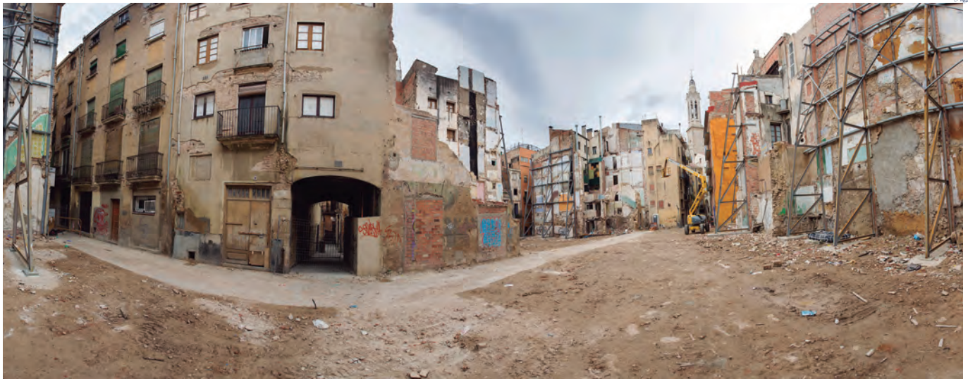
Terreny que ocupa el futur Museu Casteller abans de començar les obres