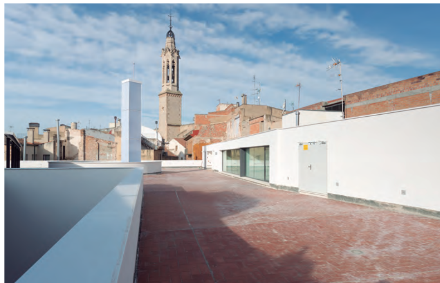
Vista de la terrassa amb el campanar de l'església de Sant Joan al fons

la: cant, mite i tradició» a la Fundació Sa Nostra de Palma de Mallorca (2008).