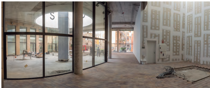
Interior del recinte museístic ara en obres

Entre els projectes museogràfics realitzats per Cristià, nascut a Cambrils, destaca el seu disseny al Museu de la Cultura del Vino Dinastia Vivanco a Briones (La Rioja, 2004), premi The Best of Wine Tourism que atorga The Wine Capitals. També sobresurten exposicions temporals com «L'Imperi Oblidat» al CaixaFòrum dedicada a l'imperi Persa amb peces procedents del British Museum, el Museu del Louvre i el Museu Nacional d'Iran (2006), o «Sibil-