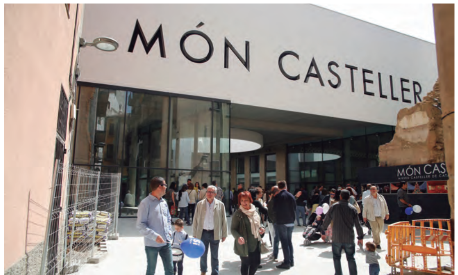
Façana principal de l'edifici, un dels espais quasi acabats

El Museu Casteller de Catalunya, a cinc minuts de cadascun d'aquests espais, serà una altra injecció urbanís-