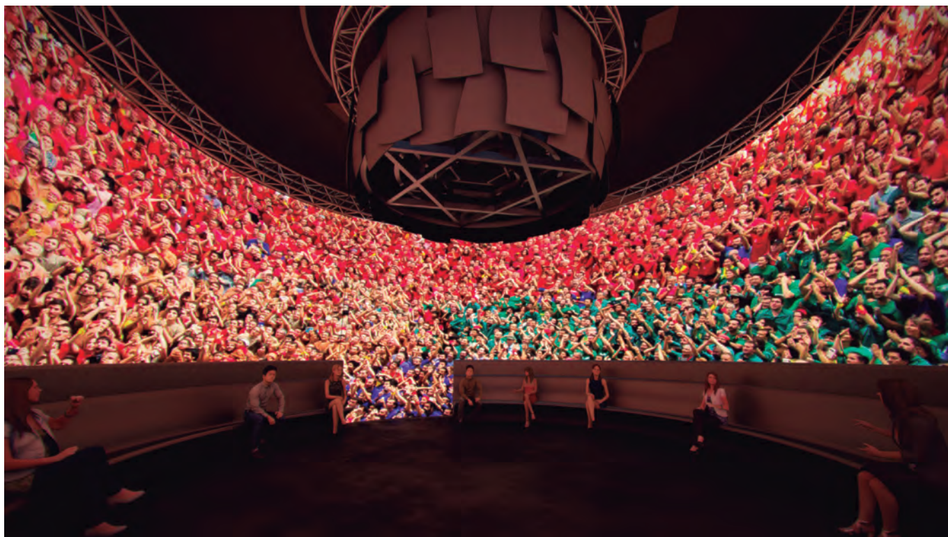
Recreació en 3D d'una zona audiovisual del futur Museu Casteller

La ciutat de Valls es prepara per gaudir, en un futur no massa llunyà, del primer i í únic Museu Casteller de Catalunya, un espai que aglutinarà una realitat del patrimoni immaterial més arrelat que es coneix i que es convertirà, també i de manera especial, en una eina perquè les persones alienes a aquesta pràctica i tradició la descobreixin, mentre que els mateixos castellers també s'hi puguin endinsar des de noves perspectives que van més enllà de la purament tècnica.