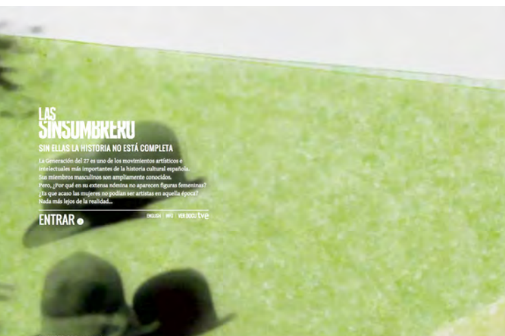
Figura 4. Portada del webdoc del proyecto Las Sinsombrero

Cada pieza ocupa su lugar en el puzzle aportando con sus herramientas específicas de significación un valor añadido a cada una de las manifestaciones de la obra. Como punto de partida, un documental, como punto de encuentro de la estrategia Transmedia, una página web. Si la intención del documental era tratar de que el espectador se identificara con las mujeres a través del mecanismo fílmico de la observación, de la nula intervención del autor, con el webdoc la retórica que facilita la identificación espectral es llevada a extremos donde el cine no puede llegar. De este modo, el minimalismo inicial del proyecto queda desbordado y las distintas facetas del diseño del producto se desarrollan incluso más que el film original. Como en muchos otros casos, la extensión transmediática de la narración no nace de una planificación rigurosa de la comercialización del producto (lo que Scolari denomina