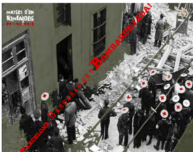
Figura 1. Imagen del proyecto Imatges de un bombardeig. Barcelona bàrbarament bombardejada

La secuencia de presentación, la única que no es navegable, arranca con el sonido de los aviones y las sirenas de los refugios antiaéreos, mientras las imágenes animadas muestran proyectiles cayendo sobre un mapa de España que acabará por desintegrarse, toda una declaración de principios del autor. Sólo esta pequeña secuencia podría condensar la esencia visual de la Guerra en su conjunto. Tras este “mazazo” significativo, el interactivo ya tiene capacidad de navegación, es decir, después de asumir la inevitable destrucción producida por la guerra, puede tratar de pensar sobre ella.