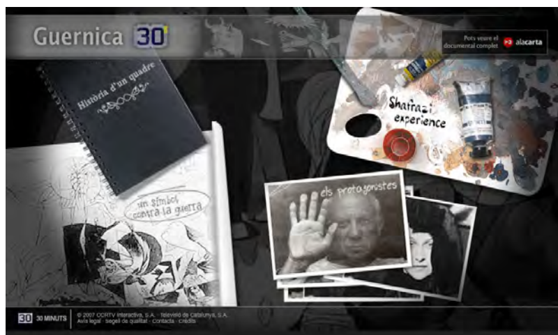
Figura 2. Interfaz del proyecto Guernica. Pintura de guerra

Es otro proyecto, sin embargo, como Guernica: Pintura de guerra , (CCRTV/Haiku Media, 2007) 2 el que demuestra que el formato, poco a poco y localizadamente, va desplegando su potencial narrativo al ritmo del avance de las herramientas para su programación y de su creciente rol como soporte digital de la memoria colectiva. En este caso, el apoyo de una televisión pública como TV3 supone un impulso definitivo al proyecto que se produce en un entorno profesional, con la colaboración de un equipo multidisciplinar de profesionales de diversos campos (diseño gráfico, periodismo, realización, programación flash, etc.). La historia, galardonada en el prestigioso Horizon Interactive Awards y organizada en torno a la metáfora sobre el horror producido por el hombre que representa la obra, cuenta con tres recorridos interactivos principales: la historia del cuadro, un símbolo contra la guerra y los protagonistas.