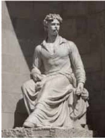
Fig. 3. Miquel i Lluçia Oslé, Monument a Marià Fortuny , 1942, marbre, 200 x 170 x 130 cm. Carrer Pintor Fortuny amb Xuclà, Barcelona.

Un cop presentada i aprovada la maqueta, els germans Oslé van començar a esculpir en marbre el Monument a Marià Fortuny , però de nou, en 1933, els problemes van ressorgir per impedir, un cop més, l'execució de l'escultura. Les obres van ser ajornades i, per tant, la seva inauguració també, fent que els germans quedessin relegats a l'espera de l'ordre per procedir amb l'escultura. Tot i això, com l'aturada de les obres no va ser per culpa de l'execució del monument, els germans van seguir amb la realització de la peça.