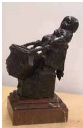
Fig. 1. Una de les primeres obres realitzades pels germans Oslé. Miquel i Lluçia Oslé, Nena amb cubell, bronze (peanya de marbre vermell), 26,5 x 16,5 x 22,5 cm (P. 7,5 x 14 x 17 cm). Reial Acadèmia Catalana de Belles Arts de Sant Jordi.

Les obres eren personals i subjectives, captivaven l'espectador i conduïen la seva mirada a través d'una realitat efímera que es materialitzava i perdurava a l'escultura. Però, amb el pas dels anys, la producció dels germans va seguir un camí totalment diferent de la senda per la qual caminaven fins al moment. A partir de 1911/1912 la seva participació en exposicions va disminuir, de la mateixa manera que les escultures lligades a la realitat social del moment. Amb la popularitat que estaven adquirint, els germans Oslé van decidir dedicar-se plenament a l'escultura i començar a realitzar obres d'encàrrec.