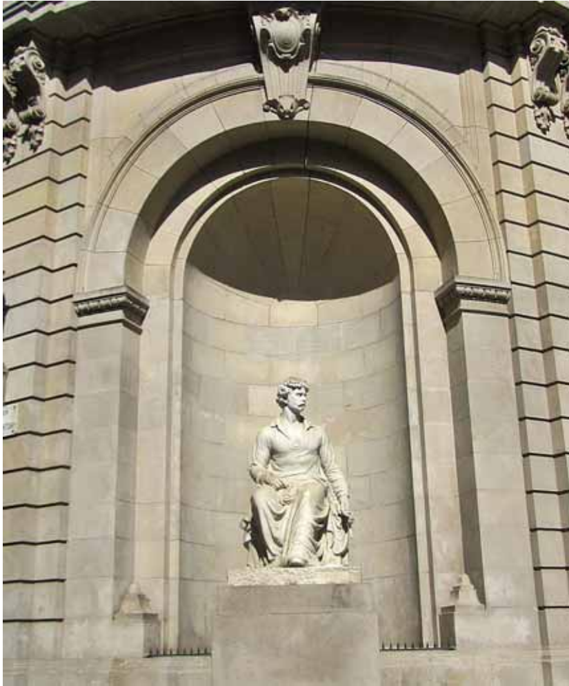
Fig. 6. Miquel i Lluçia Oslé, Monument a Maria Fortuny , 1942, marbre, 200 x 170 x 130 cm. Carrer Pintor Fortuny amb Xuclà, Barcelona.

la part posterior de l'edifici. Tot i això, l'alcalde de la ciutat, Miguel Mateu, els va comunicar que aquell emplaçament era tan sols provisional i que quan tinguessin pactat un de nou l'obra seria traslladada immediatament. 15