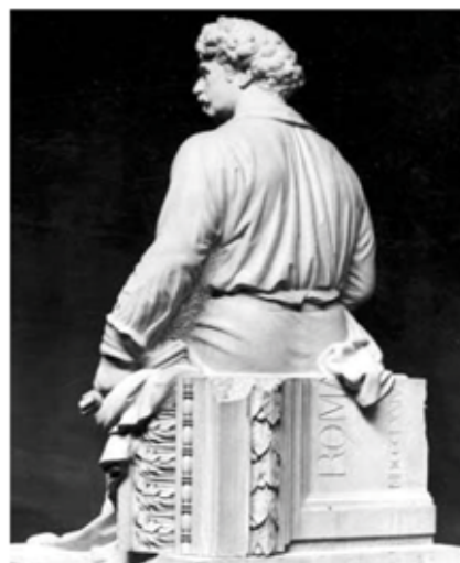
Fig. 5. Fotografia on s'aprecia el minucios treball escultòric que van realitzar els germans Oslé al esculpir l'esquena de Marià Fortuny. Fotografia extreta de l'article d'Arturo Llopis a La Vanguardia el 20 de gener de 1968, p. 39.

En aquest nou emplaçament, cap ciutadà seria capaç d'admirar l'obra en tota la seva esplendor, Fortuny seria simplement una imatge frontal amagada en un espai que l'ocultava i, gran part del treball dels escultors mai veuria la llum; l'esquena de Fortuny seria sempre desconeguda (fig. 5). És per aquest motiu que els germans Oslé, al final de la carta, transmetien la seva inquietant angoixa i plasmaven que «es doloros observar la manca absoluta d'entusiasme que existeix per les parts que debien mostrar més interès, mirant aquest assumpte amb una indiferència que fan perdre a un la esperança de assolir mai res bell per a nostre amada ciutat». 13