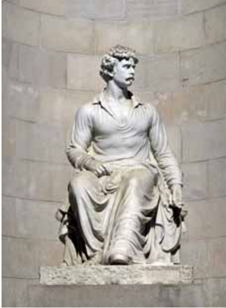
Fig. 4. Miquel i Lluçia Oslé, Monument a Marià Fortuny , 1942, marbre, 200 x 170 x 130 cm. Carrer Pintor Fortuny amb Xuclà, Barcelona.

anys havia estat director del Museu d'Art de Barcelona, resumien els antecedents de l'encàrrec. És en el moment de l'inici de la Guerra Civil on la informació que proporcionaven és més rellevant i significativa. Els germans Oslé argumentaven que: