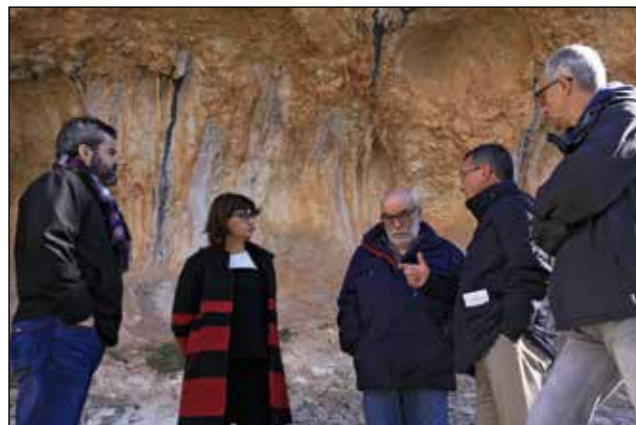
Visita de la Directora General de Cultura i Patrimoni a les pintures rupestres de la Sarga.

En 2016 han estat un total de nou alumnes de diferents universitats i centres formatius els que han realitzat al Museu les seues pràctiques formatives no remunerades.