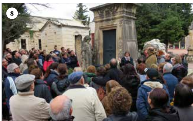
Participació en les diferents activitats del cicle "10 excursions voltant Alcoi i el seu patrimoni històric i arqueològic": 1. El Camí del Peix, acompanyament de la Marxa Romana; 2. Els ponts d'Alcoi; 3. Paisatge agrari de Barxell: el Mas del Pi Vell; 4. Ruta arqueològica de la Canal (el Puig i la Sarga); 5. Excavacions al Salt; 6. Les esglésies d'Alcoi; 7. Evolució urbana d'Alcoi; 8. El Cementeri Municipal d'Alcoi: la ciutat dormida.