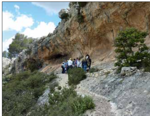
Jornades de Portes Obertes a les pintures rupestres de la Sarga.