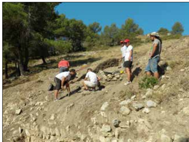
Treballs d'excavació arqueològica al jaciment medieval del Castellar d'Alcoi.

tre àmbit ha autoritzat la realització de diferents actuacions arqueològiques. Els materials arqueològics recuperats en aquests treballs s'han depositat al Museu Arqueològic Municipal d'Alcoi.