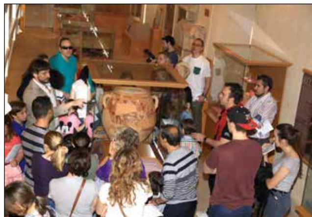
Dia Internacional dels Museus.

Aquest Museu va participar a la I Jornada Formativa de Museus i Col·leccions Museogràfiques Permanents Valencianes (Borriana, 13 de juny de 2016), organitzada per la Conselleria d’Educació, Investigació, Cultura i Esport. A aquest acte, el director del Museu va presentar la ponència “La gestió d’un museu municipal: el Museu d’Alcoi”.