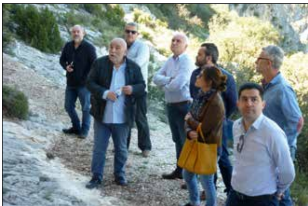
Visita del Secretari Autonòmic de Cultura a les pintures rupestres de la Sarga.