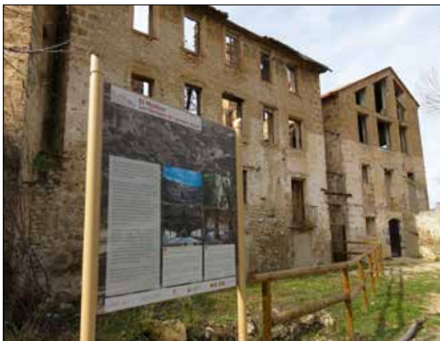
Un dels cartells instal·lats al Conjunt Històric BIC del Molinar.