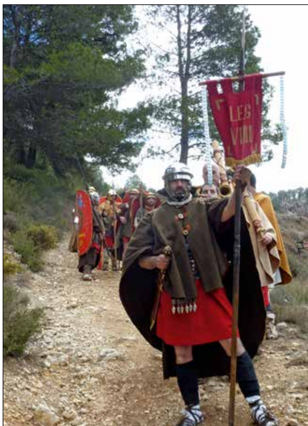
Marxa Romana pel Camí del Peix.