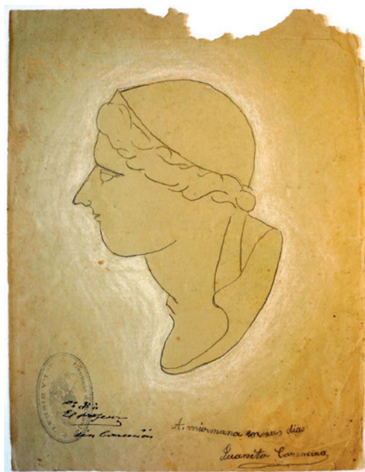
Fundació Rafael Masó