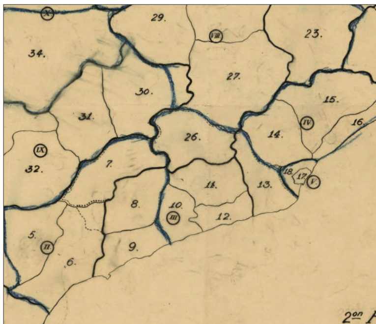
Figura 2. Detall del mapa manuscrit (traç blau) atribuïble a Pau Vila, en la seva darrera proposta de vegueries (octubre de 1932)

La numeració àrabica indica les comarques, per exemple: 10 Baix Penedès, 11 Alt Penedès, 12 Garraf, 13 Baix Llobregat i 26 Anoia. Els nombres romans indiquen les vegueries del 2n projecte, com per exemple II Reus, III Tarragona, V Barcelona i VIII Manresa.