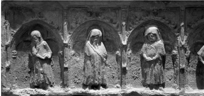
Figura 7. Detall dels tres primers plorants.

El segon factor, determinant, són les dimensions del conjunt, menors del natural, afectant tant la figura del jaçant com els plorants del frontís que, a causa de les arqueries, queden reduïts a una superfície escultòrica de poc més d'un pam, dificultant el detallisme en l'actitud i el drapejat de les figures. Tanmateix, la menor proporció no impedeix completament l'apreciació d'alguns detalls significatius i característics, que acosten igualment l'obra als treballs dels tallers reials del Cerimoniós. D'entrada l'arc trilobulat que emmarca cadascun dels plorants, rematat amb cresteria per l'extradós, comú en innumbrables exemples dels encàrrecs d'Aloi-Cascalls, a Poblet, Cornellà de Conflent, el Puig, etc. Seguidament la realització de les figures dels plorants és ben diferenciada, com