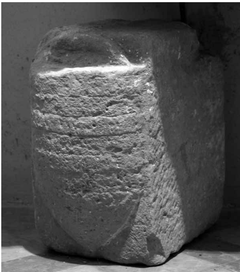
Figura 6. Mènscula amb l'escut dels Tous.

Al terra de la capella hi ha una mènscula amb la representació d'un escut faixat, identificable amb les armes dels Tous, i que probablement va pertànyer al mateix conjunt funerari. No s'aprecia cap resta de prolicromia, però segons els armorials antics les armes dels Tous consistien en faixes d'argent i atzur de sis peces. 11 Aquestes deuen coincidir plenament amb les que hi ha a Montesa, al castell de l'orde (exterior d'una torre), a l'església parroquial (pica baptismal) i un relleu donat l'any 2002 per un particular de la Font de la Figuera i que ara es custodia al Museu Parroquial de Montesa. 12 Tanta heràldica commemorativa no fa més que recalcar el paper de gran mestre batisseur que tingué Pere de Tous, al qual s'atribueixen bona part de les ampliacions del castell de Montesa, com l'església, l'aula capitular, el refectori, una cisterna, la infermeria, el