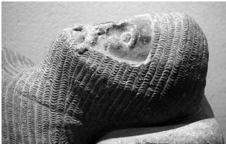
Figura 3. Detall del cap del jacent.