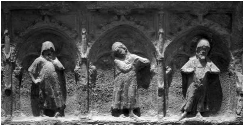
Figura 8. Detall dels plorants 4, 5 i 6.