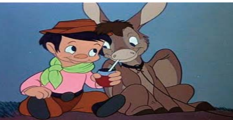
■ El gauchito volador (1945) . Cortometraje de la Disney inspirado en los dibujos del argentino Molina Campos

Molina Campos renunció a trabajar con la Disney por la falta de rigor documental de los dibujos de gauchos producidos en los Estudios