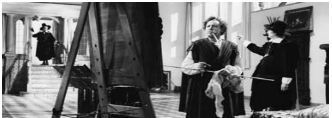
■ Rembrandt, de Alexander Korda (1936)