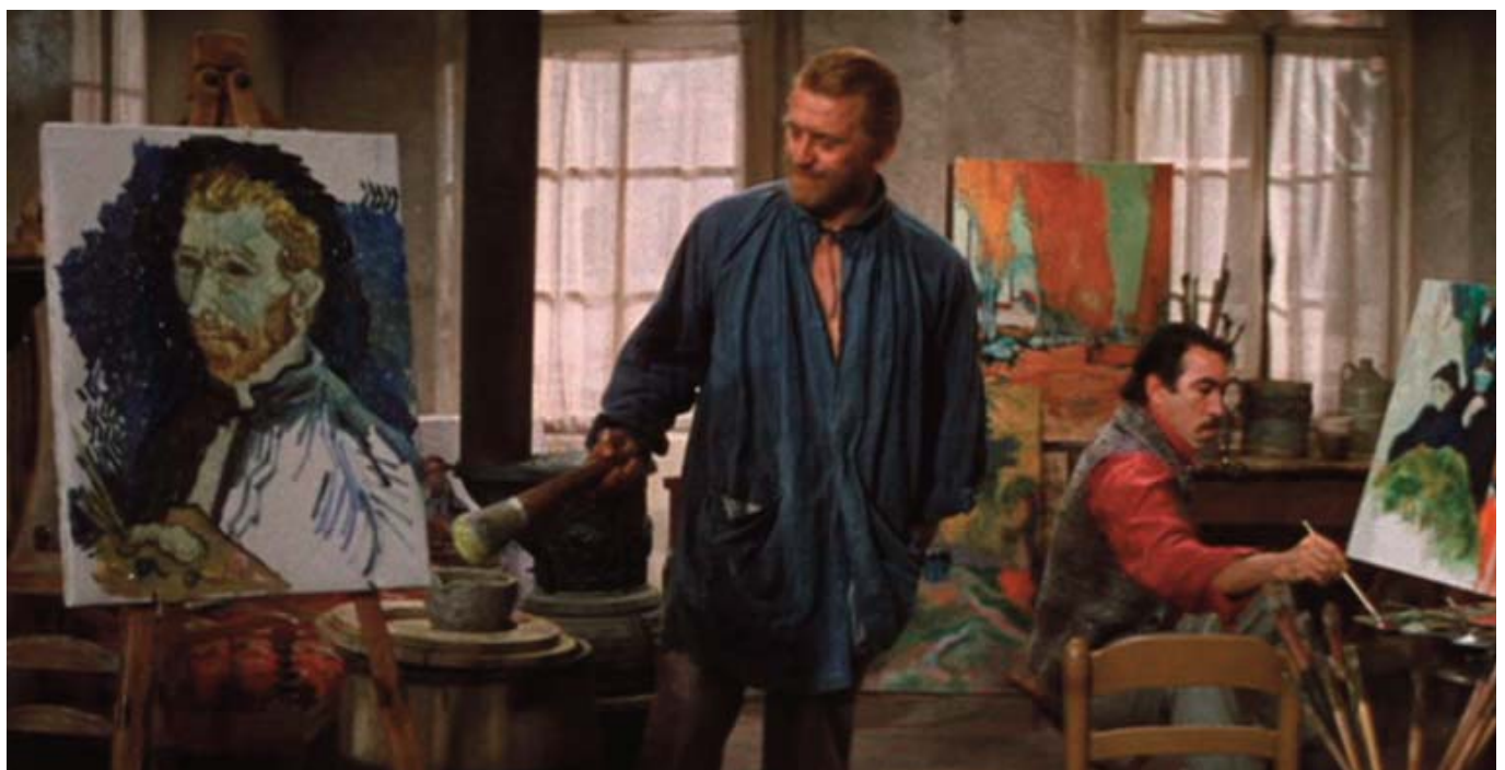
El loco del pelo rojo, de Vicente Minelli (1956)

Encarnado por Kirk Douglas, la película narra las tribulaciones de Van Gogh desde sus comienzos en su iglesia y su misticismo hasta su relación con los pintores impresionistas, sobre todo Gauguin, sus primeros contactos con la pintura en su país natal (en la cual dibujaba a los campesinos realizando la tareas más cotidianas), sus inestables relaciones amorosas y amistosas y el vínculo afectivo más importante que mantuvo en su azarosa existencia, su hermano Theo,