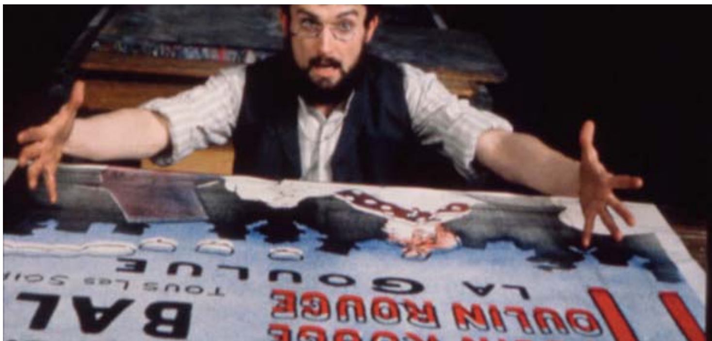
Toulouse-Lautrec , de Planchon (1998)

Su interés por el dibujo y la pintura se remonta a la infancia y pronto hizo amistad con pintores de su tiempo, entre ellos van Gogh, del que hizo un retrato. La