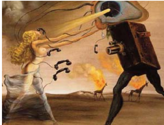
■ Salvador Dalí para Disney. Realizado en 1943 y lanzado en 2003 por la compañía