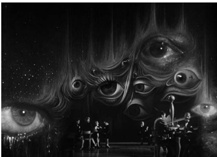
Salvador Dalí para Alfred Hitchcock. Secuencia onírica en «Recuerda» (1945).