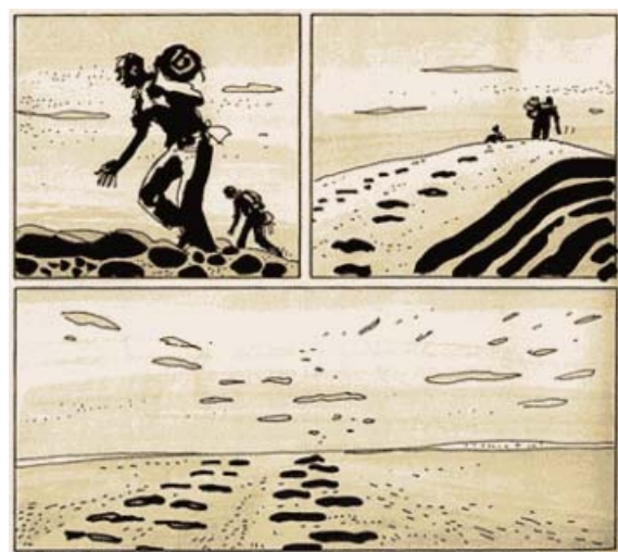
Hugo Pratt para Corto Maltés. Secuencia y diferentes planos