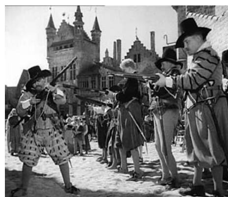
■ La Kermesse heroica (1935) . Jacques Feyder