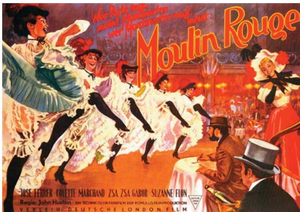
■ Moulin Rouge (1952). La vida de Henri de Toulouse-Lautrec