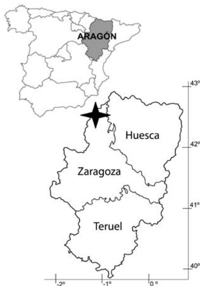
Fig. 1.- Localización de los Manantiales de Tíermas. Fig. 1.- Location of the Tíermas Springs.

la cuenca pertenecen al Triásico inferior en Facies Keuper. Sobre éstos, aparece una serie de materiales marinos depositados en la cuenca de antepaís surpirenaica y que pertenecen al Cretácico superior, Paleoceno (Calizas de Alveolinas), Eoceno inferior y medio (Calizas de Guara y turbiditas del Grupo Hecho) y Eoceno superior (Margas de Arguís–Pamplona) (Faci Paricio, 1997). En el límite Eoceno superior-Oligoceno aparece una facies evaporítica constituida principalmente por halita y anhidrita (Ayora et al. , 1995) y, finalmente, aparecen los materiales oligocenos y miocenos continentales (Grupo Campodarbe) representando las últimas fases de evolución de la cuenca (Faci Paricio, 1997).