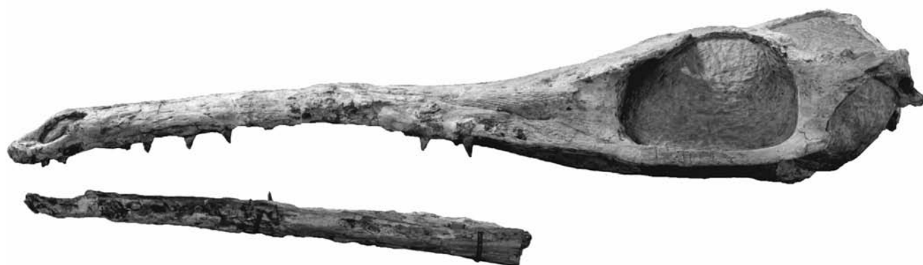
Fig. 1.- Cráneo del holotipo de Maledictosuchus riclaensis (MPZ 2001/130). Vista lateral izquierda. Escala = 5 cm.

Los metriorrínquidos alcanzaron un alto grado de adaptación al medio marino y desarrollaron glándulas de la sal hipertrofiadas, considerando el máximo grado de especialización marina en crocodylomorfos (Jackson et al. , 1996). Estas glándulas se han descrito a partir de varios fósiles excepcionalmente preservados del endocráneo de Cricosaurus araucanensis Gasparini y Dellapé 1976 (Fernández y Gasparini, 2000, 2008; Herrera et al. , 2013) y algunos ejemplares bien preservados de Metricorhynchus superciliosus Blainville 1853 (Gandola et al. , 2006).