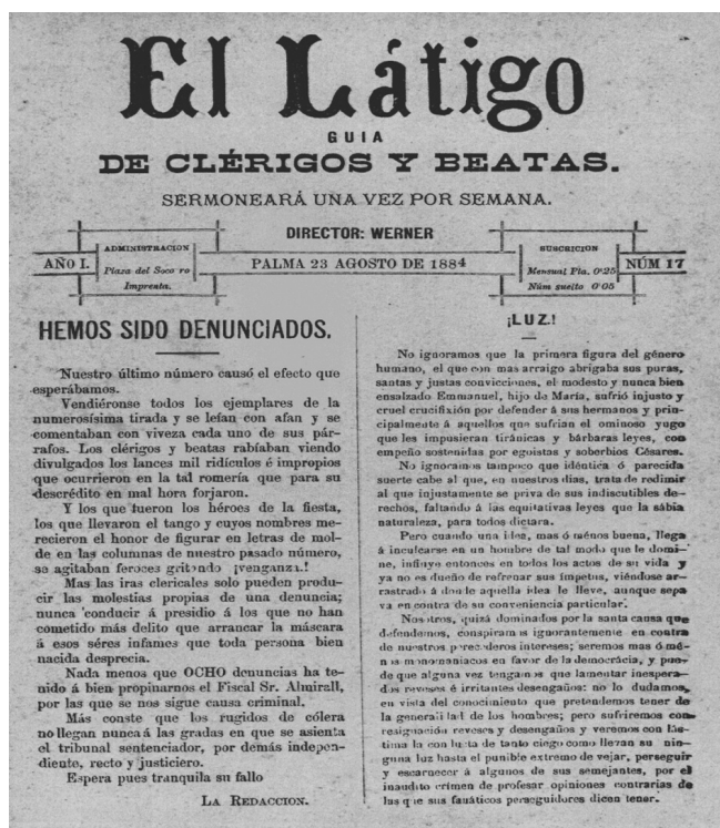
Portada del último número de El Látigo (23-8-1884)