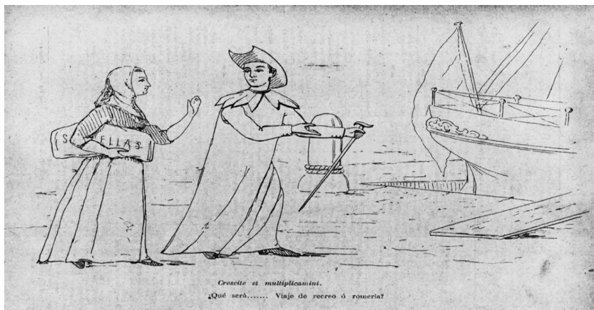
Un ejemplo de anticlericalismo. El Mosquito , 11 (29-11-1879)

Con la excusa que era delito la inserción de artículos políticos en una publicación que no tenía esta consideración, el gobernador civil mandó secuestrar todo el tiraje de este número e impuso una multa de 250 pesetas. Estas medidas provocaron el final de la publicación que, en su último número, el 11 (29-11-1879), se quejaba amargamente que diarios no políticos como El Isleño o El Anunciador ofreciesen noticias políticas sin problemas. Además, el semanario rival, El Ignorància , también podía hacer su propaganda política sin chocar con el fiscal o el gobernador.