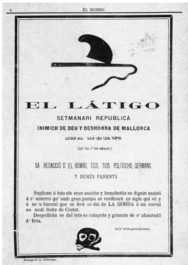
Parodia de esquila mortuoria publicada en El Bombo (6-9-1884)

En octubre de 1884 apareció otro semanario ultraconservador, El Tambor . De carácter inicialmente satírico como El Bombo , evolucionó hasta convertirse en un semanario político serio. Así, su primer subtítulo fue «Instrument tocat a dues veus per una colla de voluntaris valents y poch dormidós», que cambió pronto por «Setmanari d'es nostros» y finalmente «Semnario Católico Tradicionalista de las Baleares».