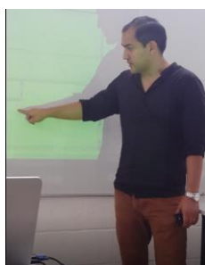
Figura 2. En las aulas de clases de la carrera de Arquitectura – Facultad Arquitectura