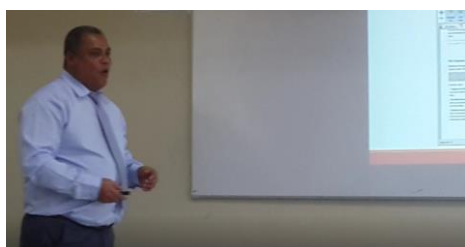
Figura 1. En las aulas de clases de la carrera de Derecho Facultad Jurisprudencia

el caso de la gente de Daule inmediatamente tuvimos que contratar empresa mediadoras para que san guiarán el área de hecho fue muy interesante porque utilizaron incluso de a un profesor de ingeniería química de la universidad de Guayaquil ellos generaron un polímero y ese polímero lo dispersaron en la zona y le pegaron palores y se hizo como un plástico y en ese plástico se pegaron todos los hidrocarburos fue bien interesante porque contrataron a varias compañías y una de las compañías lo que hizo fue llevar plumas de aves y ciertos compuestos para que se adhirieran los aceites pero la más interesante fue esa de ingeniería química porque realmente se vio cómo es un muy buen absorbente de las grasas”, (Video-40) Ingeniería Ambiental, tema “La Reiteración”.