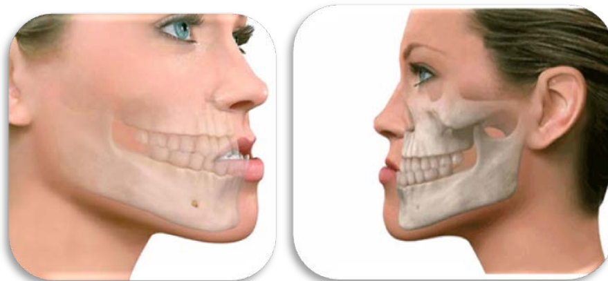
Figura 1 – Prognatismo Mandibular