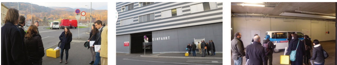
Abbildung 5 Impressionen von der Mobilitätsexpedition in der Stadtregion Bruck-Kapfenberg-Leoben

Kurz vor der Veranstaltung wurde entschieden, alle Wege mithilfe von Reisebussen der MVG abzuwickeln. Das Risiko von Verspätungen oder dem Verpassen von Linienbussen war zu groß, im sehr dichten Zeitplan hätten sich Verzögerungen schnell auf die weiteren Programmpunkte ausgewirkt. So änderte sich die geplante Reihenfolge für die Gruppe Güterlogistik: zuerst wurde der Montanterminal Kapfenberg besucht, dann anschließend die Innenstadt von Leoben.