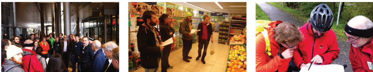
Abbildung 3 Impressionen von der Mobilitätsexpedition in Graz, Raaba und Hart

Die gesammelten Materialien wurden im Rahmen eines Beitrags für ein Projekt-Booklet in Form einer Tabelle sowie einer Karte ausgewertet. Kriterien in der Tabelle waren z. B. die zurückgelegte Strecke oder die verwendeten digitalen oder analogen Navigationshilfsmittel.