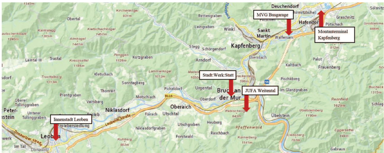
Abbildung 4 Verortung der Stationen der Mobilitätsexpedition in der Stadtregion Bruck-Kapfenberg-Leoben, Grundkarte: basemap.at