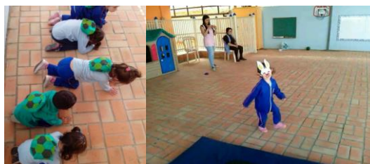
Figura 1- As crianças andando como tartarugas e imitando a Lebre

Primeiramente nós propusemos às crianças que brincassem de imitar os animais, no caso os animais da história contada “A lebre e a tartaruga”.