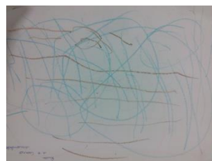
Figura 5 – Desenho C1