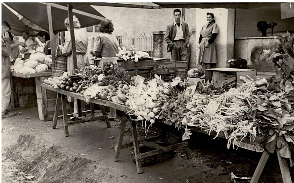
Figura 3 - Barraca típica de feiras livres - Cidade de São Paulo, década de 1950.

As feiras livres na cidade de São Paulo, funcionam desde o século XVII, mas foram devidamente formalizadas apenas no século XX. Inicialmente, havia uma oficialização para venda de produtos da terra, como hortaliças e peixes, em um local pré-determinado (Figura 3). O ano de 1948, é criada uma lei que determina uma feira semanal para cada bairro da cidade (BRASIL, Prefeitura de São Paulo, 2017).