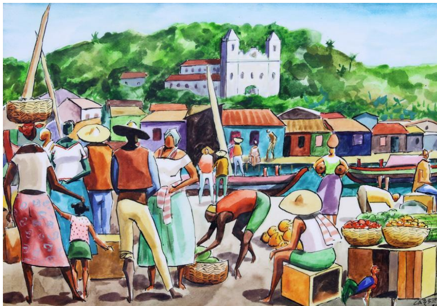
Figura 1 - A “Feira”, pintura que retrata a feira livre na Bahia