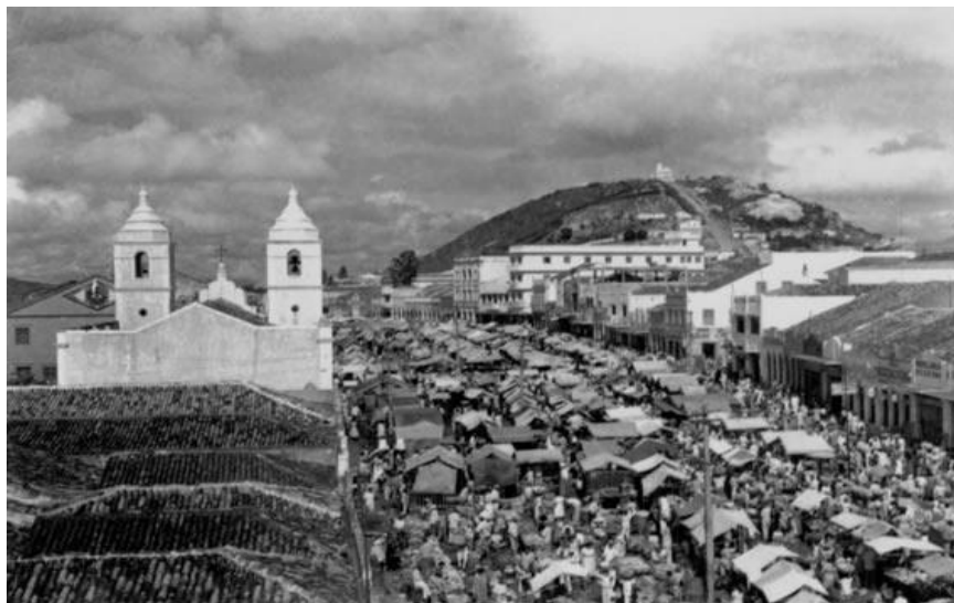
Figura 2 - Feira livre de Caruaru, mostrando casas, igreja e pequenos edifícios ao redor - Pernambuco (1960).