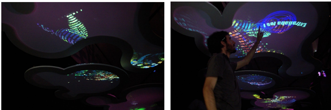
Figura 2. Entorno de Sensible 2.0, Ecosistema Textual , Proyecto Biopus, 2008. // Figura 3. Sensible 2.0, Ecosistema Textual en acción, Proyecto Biopus, 2008.

mensajes de textos enviados por el público desde sus celulares, se transforman en organismos virtuales, partes de un ecosistema mayor (figura 2). Cuando la instalación recibe el mensaje de texto, éste se transforma en una criatura que se mueve e interactúa dentro del ecosistema, comunicándose con otros mensajes de texto, creciendo y transformándose. A su vez, el público también puede interactuar con estos organismos a través de una pantalla sensible al tacto, que permite que la gente 'alimente' a las criaturas (figura 3). Una forma de interacción posible en la obra se da cuando dos de estas 'criaturas' contienen palabras comunes y entonces pueden vincularse y reproducirse. Cuando dos mensajes se reproducen, los emisores de los mensajes originales reciben, en sus celulares, los mensajes 'hijos' de esta reproducción.