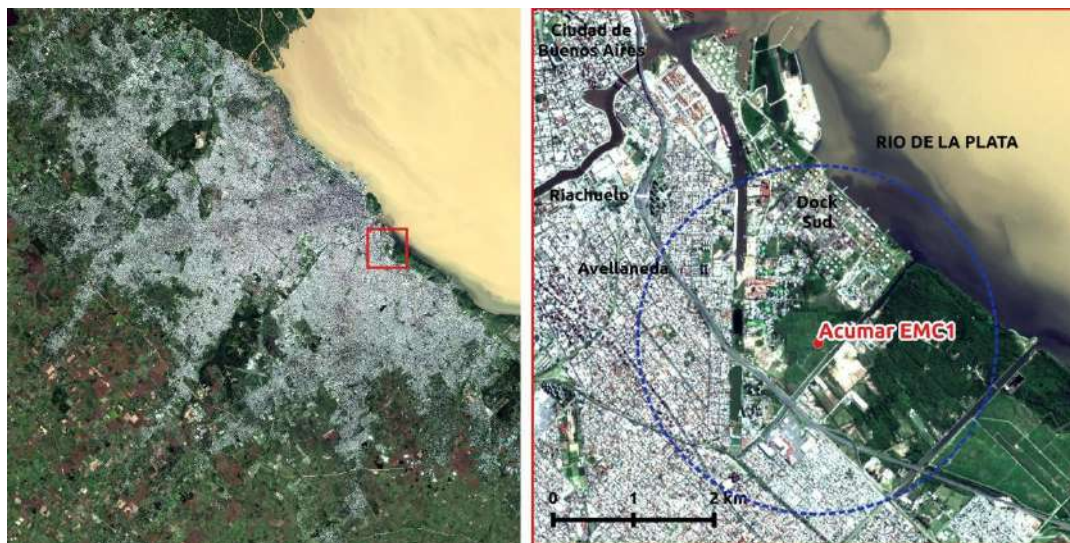
Figura 1. Región Metropolitana de Buenos Aires (izquierda) y ubicación de la Estación de Monitoreo Continuo y Automático de la Calidad del Aire en Dock Sud (EMC I) (derecha). El círculo azul indica el área de influencia de la estación.

Para este trabajo se utilizó la información provista por ACUMAR correspondiente a la estación de monitoreo continuo y automático ubicada en el área de Dock Sud, Partido de Avellaneda (EMC I: 34^{\circ}40'2.55'' S - 58^{\circ}19'45.23'' O, Figura 1). Los datos fueron obtenidos del portal de ACUMAR: http://jmb.acumar.gov.ar:8091/calidad/programa.php (último acceso 15/04/2017).