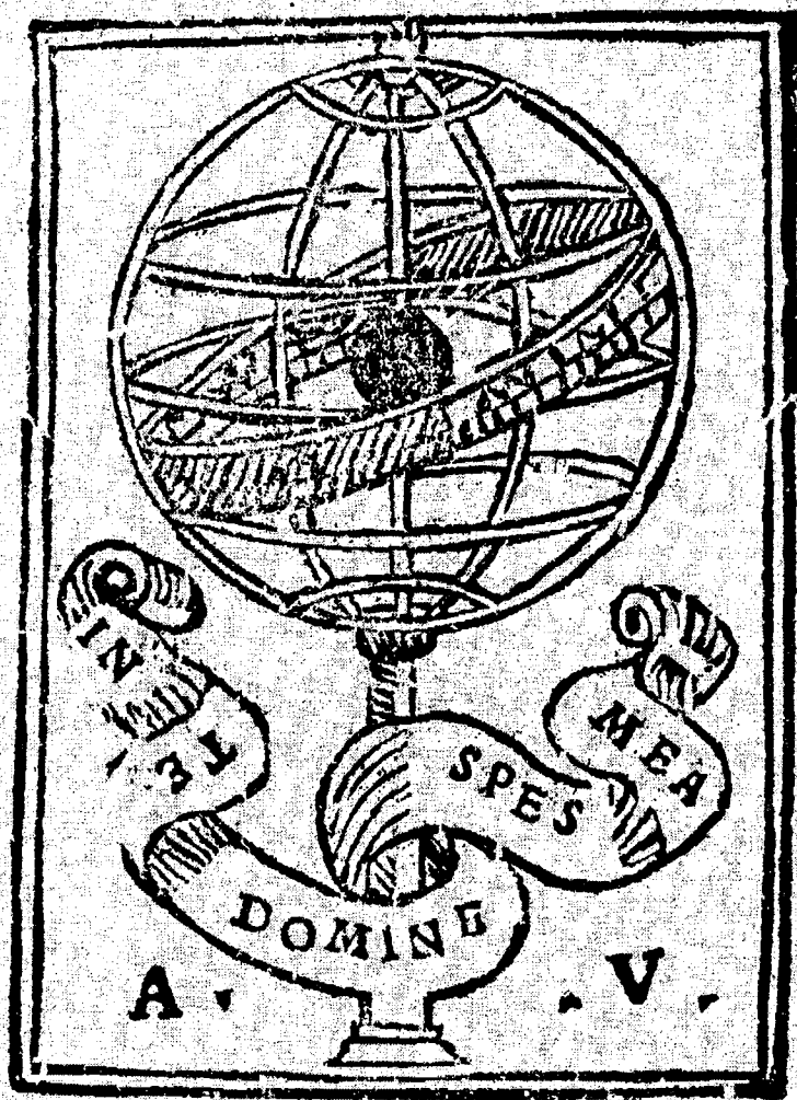
Fig. 1 - Marca do impressor Duarte Pinel, alias Abraão Usque.