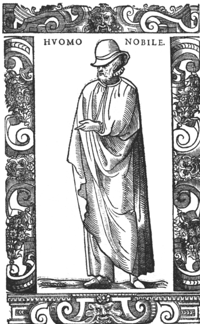
[Fig. 3] O Nobre Florentino, in Cesare Vecellio, De gli habiti antichi, et moderni di diuerse parti del mondo libri due , Veneza, Damiano Zenaro, 1590, fl. 233v. Totalmente envolto num áulico manto ( mantello ), da sua indumentária se vislumbra apenas o chapéu de abas ( cappelli di feltro ), a volta de canudos, ou gola encanudada de linho branco, o mantéu de camisa tão distintivo do trajar deste período, e os pantufos ( pianelle ). Colecção de Hugo Miguel Crespo.