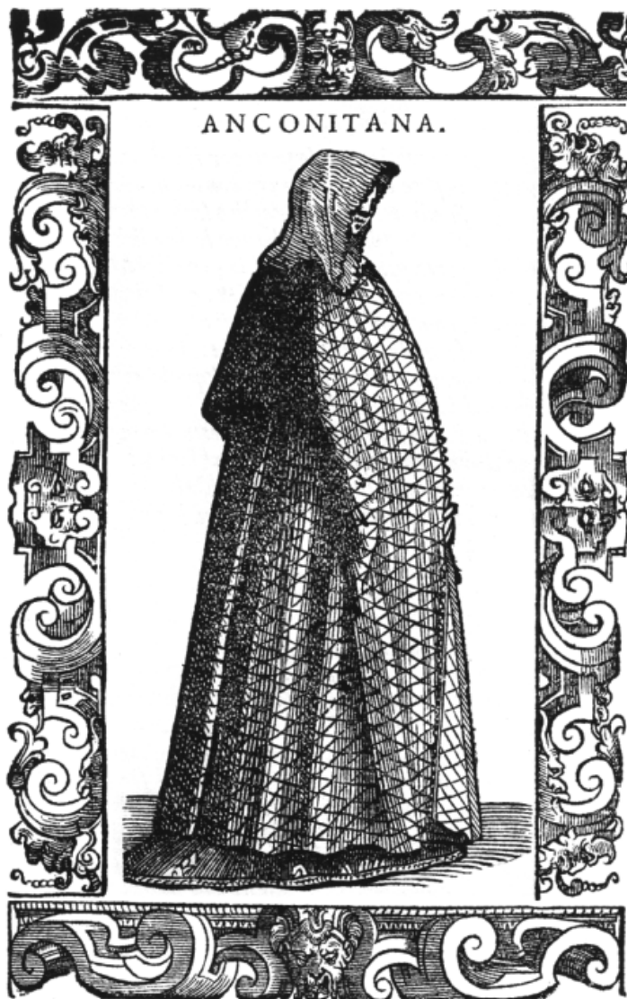
[Fig. 1] A Anconitana , in Cesare Vecellio, De gli abiti antichi, et moderni di diuerse parti del mondo libri due , Veneza, Damiano Zenaro, 1590, fl. 201. Coberta com um véu de fina matéria têxtil, que quase lhe esconde o rosto, a Anconitana enverga largo manto de tecido lavrado ( ferandina ad opera ); apenas por entre a sua abertura central, ajustada com as mãos, e junto aos pés (que porventura calçam pianelle ) se vislumbra a saia do saio ( veste ) ou a fímbria da camorra ( gamurra ). Coleção de Hugo Miguel Crespo.