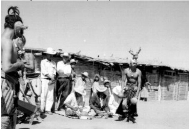
Figura 2: Integrantes de la tribu yaqui ejecutando la Danza del Venado