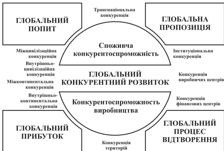
Рис 1. Система глобального економічного розвитку

Підсумки соціально-економічного розвитку України у 2007 р. засвідчують збереження високих темпів економічного зростання при посиленні ролі в цьому зростанні складових реального сектору економіки (промисловості та будівництва) та випереджаючому зростанні інвестиційної діяльності. Спостерегалася комбінована дія внутрішнього споживчого та інвестиційного попиту та експортного чинника як рушіїв економічної динаміки. Головними позитивними тенденціями динаміки реального сектору економіки стали: