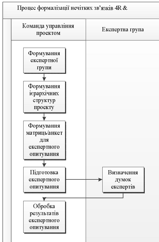
Рис. 2. Функціональна модель процесу формалізації нечітких зв'язків 4R & WS у нотатції «Процедура»

2. Формування ієрархічних структур робіт, вимог, ризиків, ресурсів проекту та організаційної структури проекту. В рамках запропонованого методу [9] рекомендовано матричну форму представлення інформації.