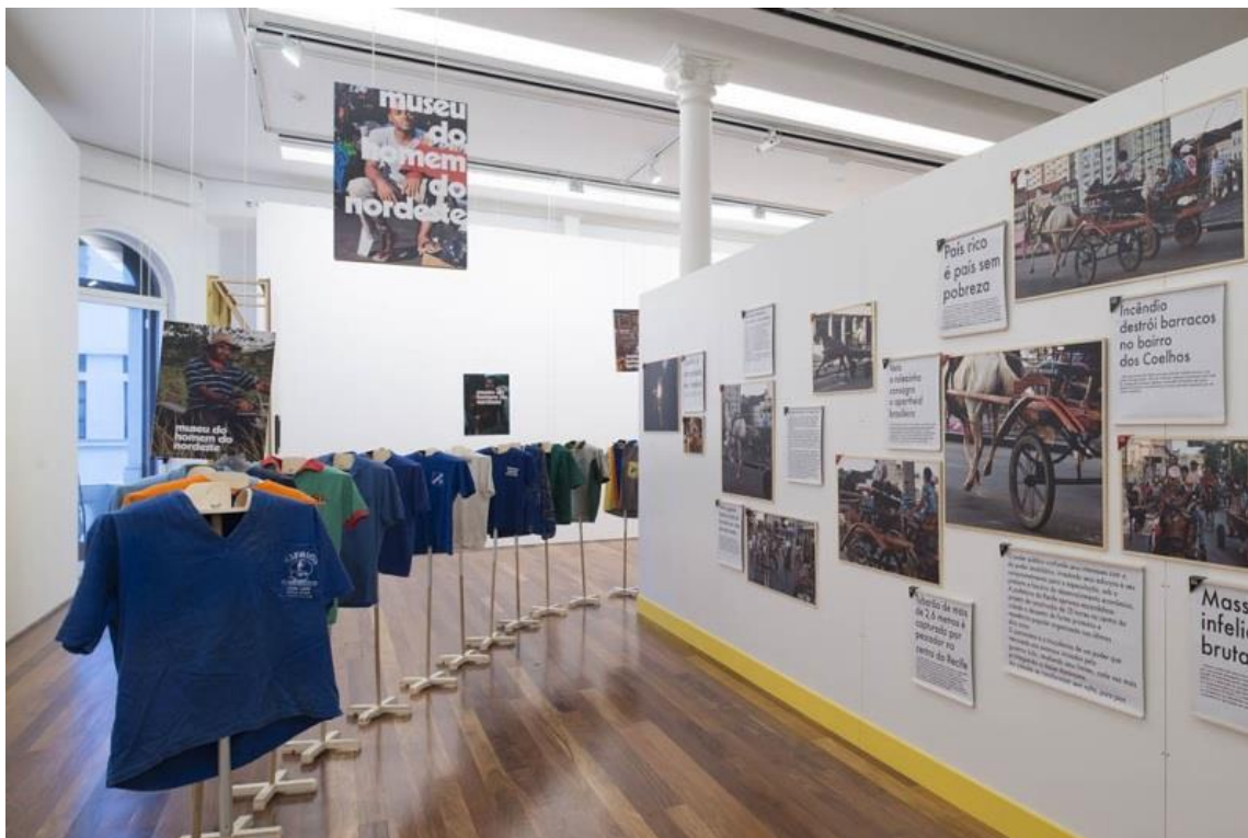
Figura 4 – Instalação Suar a Camisa (2014-2016) e Cartazes para o Museu do Homem do Nordeste (2013-2015). Na parede O que sobrou da primeira Corrida de Carroças do Centro do Recife (2014).