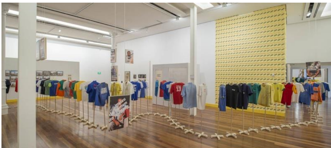
Figura 5 – As instalações Suar a Camisa (2014) e Cartazes para o Museu do Homem do Nordeste (2013). Ao fundo Departamento de Ética e Culpabilidade (2014) e O levante (2013).

Dentro do Plano Museológico do Museu do Homem do Nordeste e do Museu de Arte do Rio, posso destacar as seguintes descrições sobre a missão