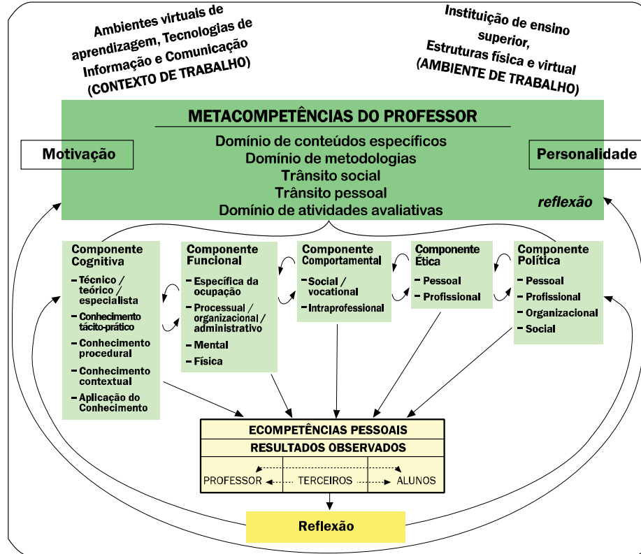
Figura 1 - Modelo de e-competences docentes no ensino superior