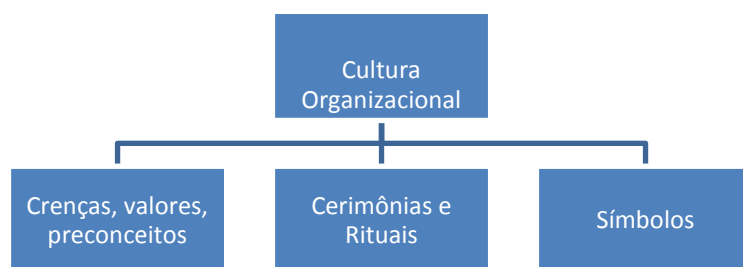
Figural. Componentes da Cultura Organizacional.