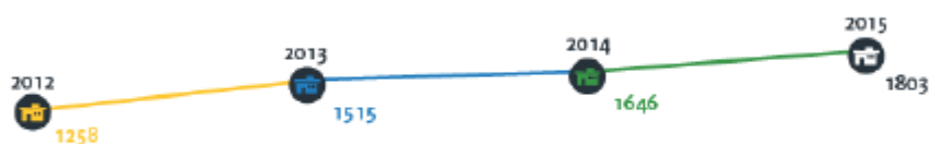
Figura 2: Número de projetos das empresas respondentes

A pesquisa ainda aponta para uma evolução de 42% do número de projetos das empresas respondentes a Figura 2.