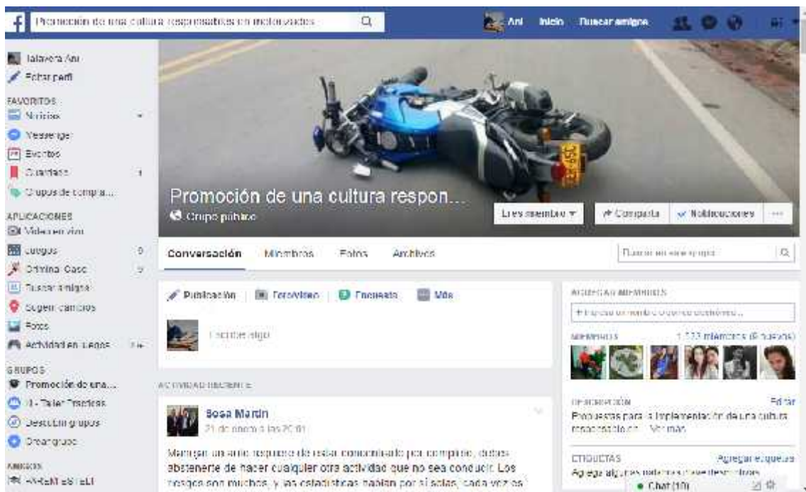
Fotografía: Diseño de página de Facebook para la prevención de accidentes de tránsito

“Educando al joven, tendremos buenos ciudadanos, Educando al ciudadano tendremos mejores automovilistas”.