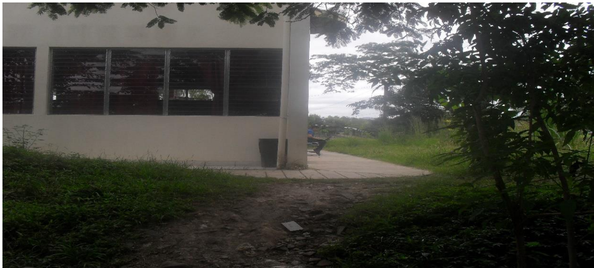
Lavandería detrás UNEN