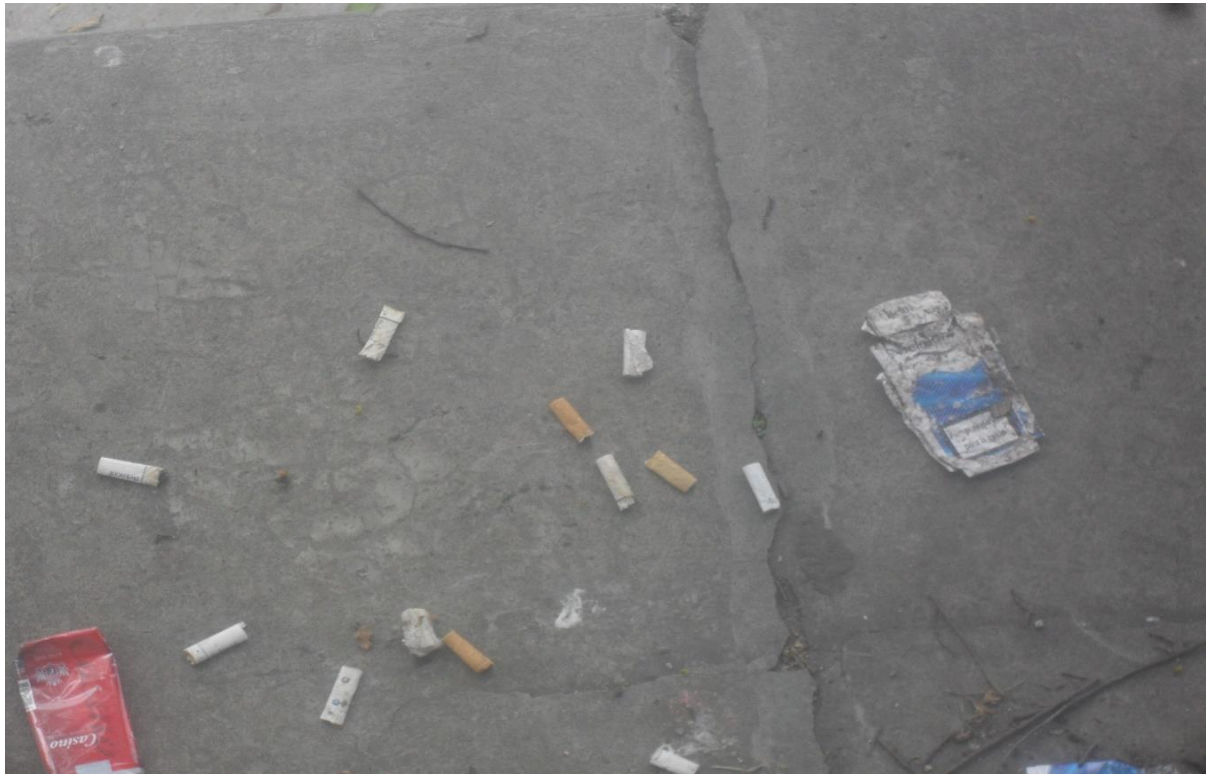
Costado oeste del edificio nuevo