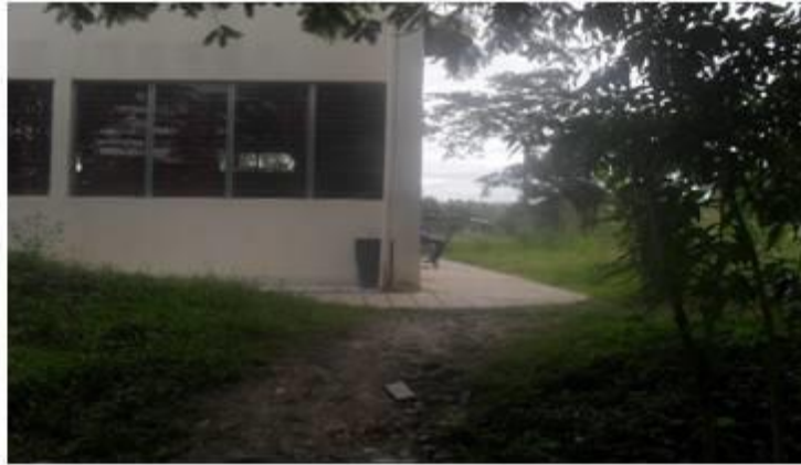
Fotografía: Costado Noroeste Edificio 600 FAREM-Esteli

En cuanto a las áreas de consumo dentro de la universidad ambos grupos entrevistados mencionan el área de la cancha como uno de los espacios de consumo, los estudiantes ocupan tiempos libres entre las asignaturas como el receso y al inicio de la jornada de clases.