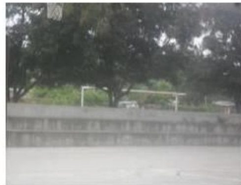
Fotografía: Gradas Cancha de basquetbol FAREM-Estelí