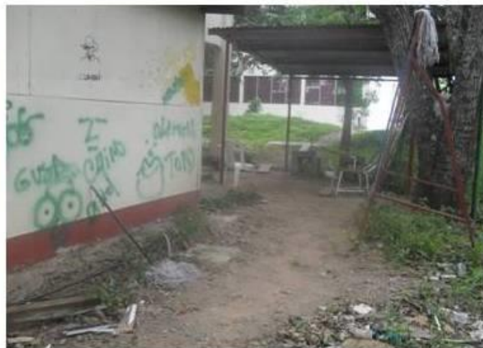
Fotografía: Lavandería de lampazos FAREM-Estelí