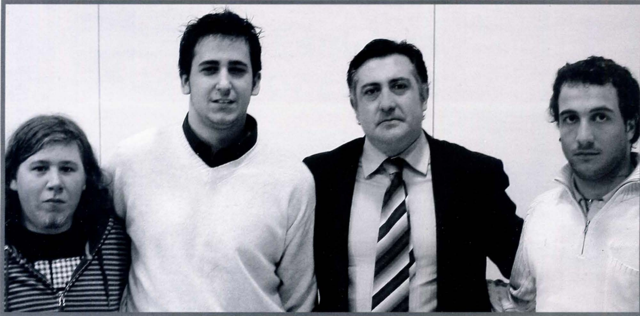
Membres dera JEROC damb Puigcerçós