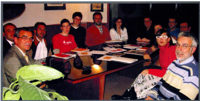
Constitucion en Les

Era preséncia de Esquèrra Republicana de Catalonha ena Val d'Aran ven obligada peth besonh d'aportar ara politica aranesa ua ideologia diferenta as qu'aporten eth Partit Socialista e Convergència Democràtica, partits damb ua trajectoria politica que ja non respon as besonh deth país.