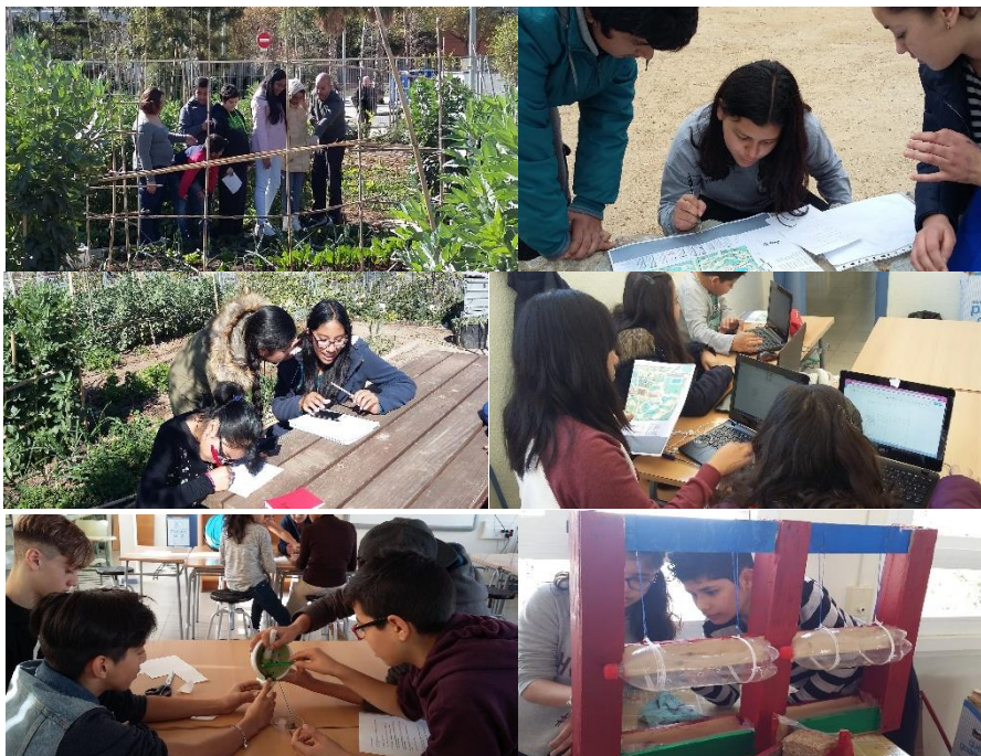
Figura 1. Alumnes de l'Institut de Cornellà visitant els horts socials de Sant Ildefons i preparant el itineraris botànics el Parc de Can Mercader, comprovant les hipòtesis al voltant de les plantes i construint horts urbans.