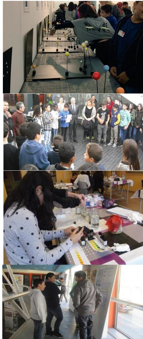
Figura 2. a) Maquetes de les constel·lacions principals del projecte XYZStars b) Inauguració de l'exposició XYZStars al Museu el curs 2015-16. c) Treball al laboratori per a l' Earth Fluids Scientific Congress . d) Sessió de pòsters durant el Congrés.

del seu propi entorn. L'objectiu d'aprenentatge que es proposa és sobretot de caire procedimental - introduir els alumnes en la metodologia científica, l'anàlisi crític dels resultats i la comunicació científica -, però també conceptual - els cicles biogeoquímics i les problemàtiques de contaminació. Des de diferents matèries es fan aportacions significatives, en la representació de gràfics (Matemàtiques), l'elaboració d' abstracts (Anglès) i la competència lingüística (Llengua).