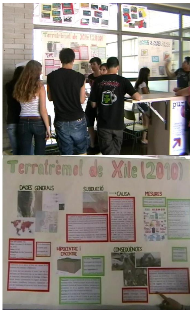
Figura 1. Grup d'estudiants de 4t d'ESO de l'INS Castellar durant la realització de la sessió de pòsters al vestíbul del centre.

Els alumnes van dedicar dues sessions i mitja a l'elaboració dels pòsters. La sessió de presentació dels pòsters es va realitzar al vestíbul de l'institut per a poder disposar d'un espai més ampli. Durant aquesta sessió, cada grup s'havia d'organitzar de manera que sempre hi hagués algun dels seus membres (rol "d'informador/a") per anar explicant els continguts del seu pòster als altres grups d'alumnes que hi anessin passant, així com aclarir-los aquells dubtes que els plantejessin. Mentrestant, els altres membres del grup havien d'anar revisant els pòsters d'altres grups (rol de "cercador/a" d'informació) i anotant els continguts més rellevants en un full de síntesi. Aquests rols eren rotatoris o bé fixos a criteri del grup