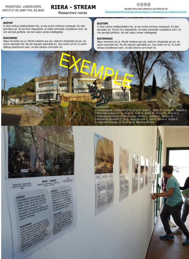
Figura 3. a) Plantilla per a la creació d'un pòster científic. b) Imatge de l'exposició de pòsters.

Per a fer les diverses tasques, es proporcionen als alumnes bastides i rúbriques d'orientació.