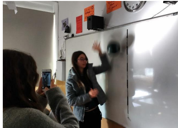
Figura 2. Alumnes fan servir els seus smartphones per a realitzar experiments de física a l'aula.

mesurar l'acceleració de la gravetat o per enregistrar l'acceleració centrípeta d'un moviment circular, etc.