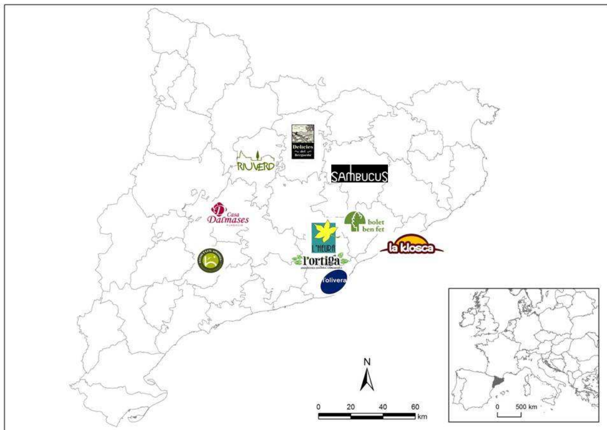
Figura 3 – Mapa de la ubicación de las entidades seleccionadas

Además de esto es un catalizador de alternativas económicas, fundamentadas en una nueva concepción de la agricultura, ecológica y de proximidad, pero también de la colaboración con otras actividades de un área determinada. En las áreas periurbanas, estos beneficios han permitido recuperar terrenos abandonados, hacer retroceder las áreas forestales y dar una orientación económica viable a muchos proyectos de AS. En nuestra investigación hemos seleccionado diez proyectos en Cataluña que abarcan 3 casos en el periurbano de Barcelona (PEB), 3 en municipios rurales (MUR) y 4 en el ámbito rural con fuerte dependencia urbana (RUB).