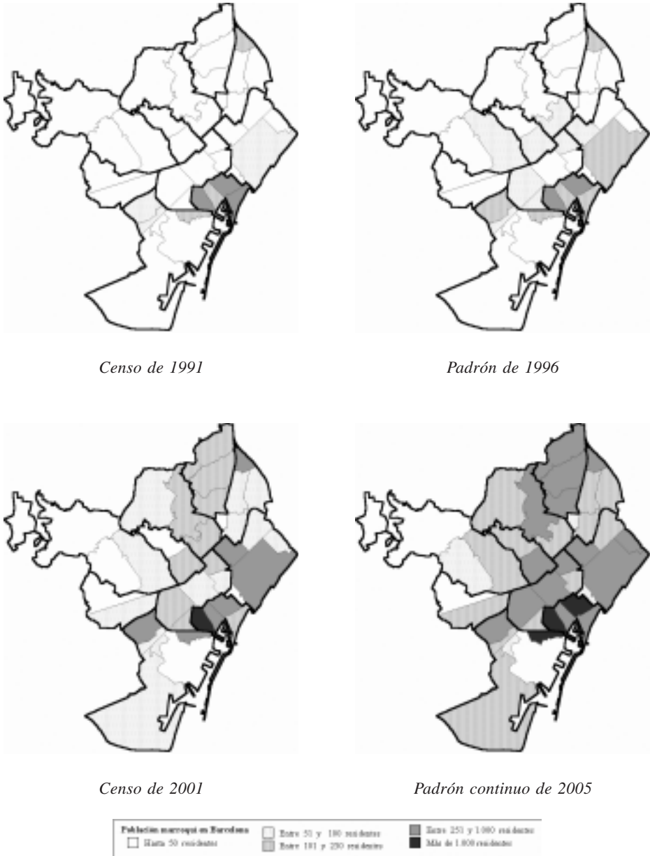
Figura 1. Distribución espacial de la población de nacionalidad marroquí a nivel inframunicipal (ZEG). En valores absolutos, 1991-2005

Fuente: Censos y Estadística de población del padrón de 1996 (Idescat); Padrón continuo 2004, web del Ayuntamiento de Barcelona. Elaboración propia.