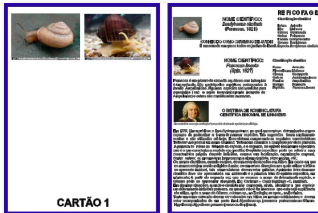
Fig. 3. Exemplo de cartão do material disponibilizado na sala-ambiente

Assim, os 16 cartões compuseram a estratégia educacional e ficaram à disposição dos atores sociais na sala-ambiente, como resultados desta pesquisa voltada para a construção/desconstrução de concepções sobre questões ambientais e de saúde.