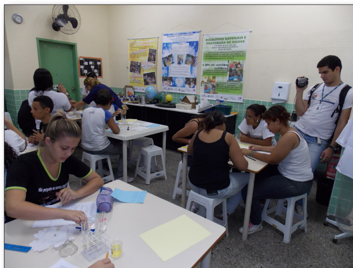
Fig. 1. Pesquisa etnográfica na “sala-ambiente”