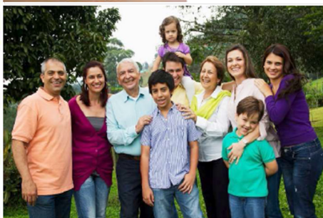
Figura 2: Imágenes seleccionadas por los jóvenes latinoamericanos relativas al arraigo cultural.

Estos vínculos identitarios con los países de procedencia parecen tender a debilitarse cuanto mayor es el tiempo de permanencia en España. Como se apuntaba en una investigación de la Universidad de Huelva del año 2007 sobre identidades, redes sociales y adolescentes inmigrantes, “Un mayor tiempo de estancia en España, parece afectar, a una debilitación de las señas de identidad hacia el origen migratorio, mientras que se fortalecen las identificaciones territoriales múltiples.” (Gualda, 2008, p. 117).