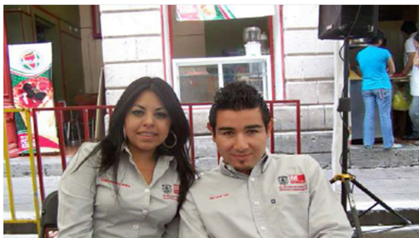
Figura 3: Imagen de amistad con el otro sexo (Seleccionada en focus de chicos y de chicas).