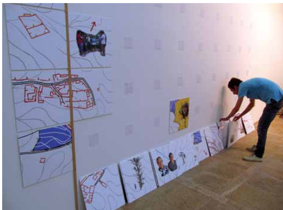
Montaje de la exposición “Xeografías do Mancomún”

Y evidentemente nostrxs también tenemos unos conocimientos situados, cada unx de nosotrxs, lxs impulsorxs de Montenoso, venimos con una mochila cargada de experiencias, pensamientos, certezas, incertidumbres y dudas que condicionan nuestra manera de ver el mundo. Así entre unxs y otrxs fuimos construyendo este proyecto común que tiene