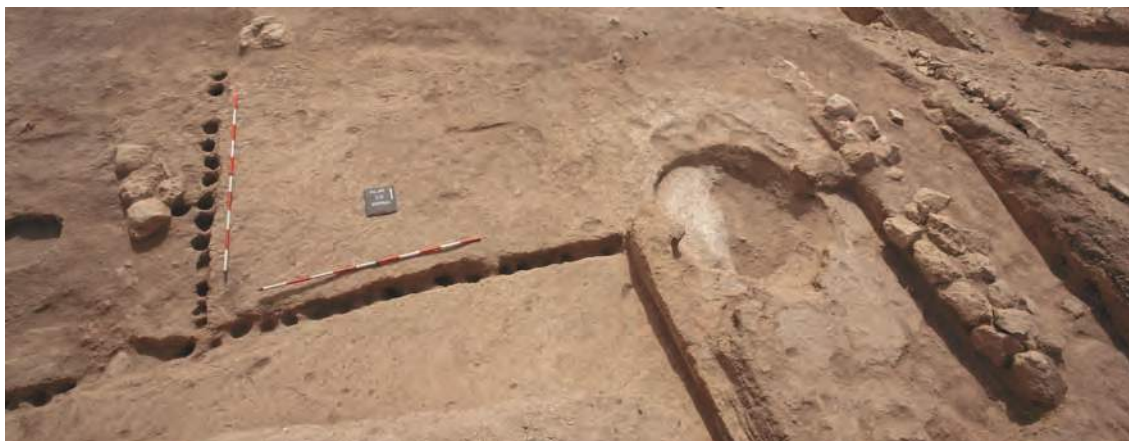
Figure 5: Vue générale du carré 2G avec l'aire extérieur où l'on trouve les 51 trous de poteau qui constituent une palissade. (PPnB récent)

res, ...), nous pouvons établir un parallèle avec les installations décrites dans les phases les plus récentes du village (pré-halaf et halaf). Au vu du manque criant de données dans le levant nord, les études concernant les phases PPnB récent demeurent particulièrement importantes.