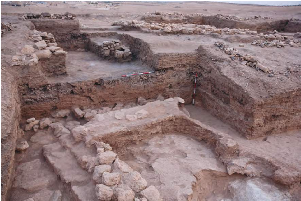
Figure 6: Vue frontale des carrées de fouille 2G, 2h y 2I, ou on peut observer la superposition des occupations PPNB récent et Prehalaf.

une autre couche formée par un sédiment grisâtre, très fin, et qui a révélé une importante quantité de restes de faune. Celle-ci correspond à l'une des premières couches découvertes et fouillées en 2006 lors du début de la fouille du carré 2G.