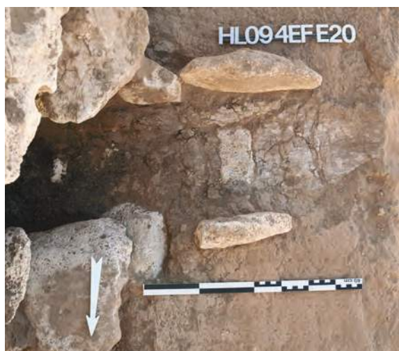
Figure 2: Vue en détail et en plan de la structure d'écoulement découverte à l'intérieur du mur (4EFE20) (PPnB moyen).

dans notre compréhension des techniques de construction. Elles nous offrent par ailleurs des indications précieuses sur l'utilisation de l'espace, et par conséquent sur son organisation sociale.