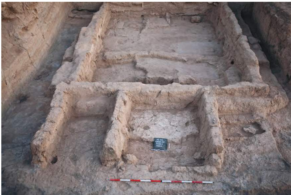
Figure 3: Vue générale du carré 4D (maison DE) correspondant à la phase d'occupation 7 (PPnB moyen).