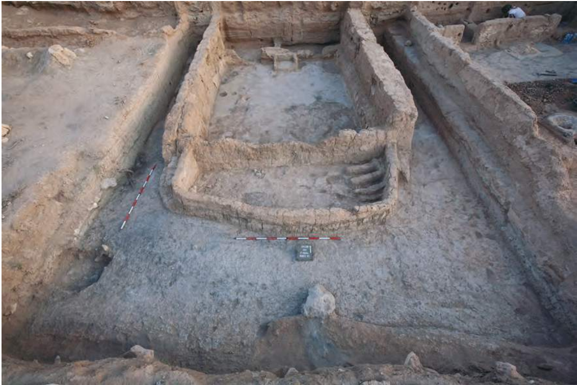
Figure 1: Vue générale du carré 4h, avec la maison hF (Fo 09) avec le porche en premier plan. (PPnB moyen).