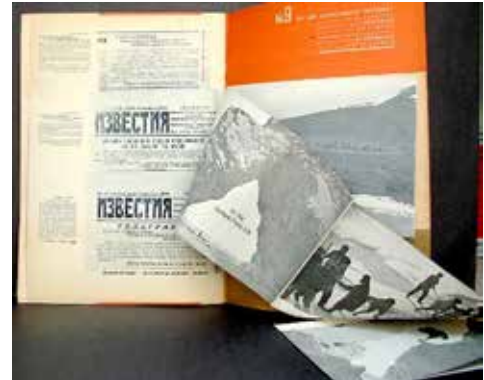
Figura 11. Lissitzky, et al. desplegable en el interior de la revista USSR en Construcción . 1933, nº9. Editor G. Piatakov.

De todos ellos, el primero, el dinamismo visual o perceptivo es quizás el más comúnmente utilizado también por otros creadores, mientras que sus organizaciones espaciales eran innovadoras al implicar activamente al sujeto. Los otros niveles de dinamismo son hallazgos propios de nuestro autor, aunque, sin ser totalmente exclusivos de él, marcan su peculiar trayectoria profesional e ideológica. El Lissitzky creía que sus dispositivos propiciaban la activación del visitante rescatándolo de su atonía contemplativa. En palabras de Isabel Tejada Martín (2014: 150): "...despertaría su autoconciencia entendida en términos marxistas. Esta idea, hija del idealismo utópico de los artistas constructivistas, otorgaba al arte la facultad de cambiar la sociedad. Un poder revolucionario del arte que se reveló en breve como un espejismo".