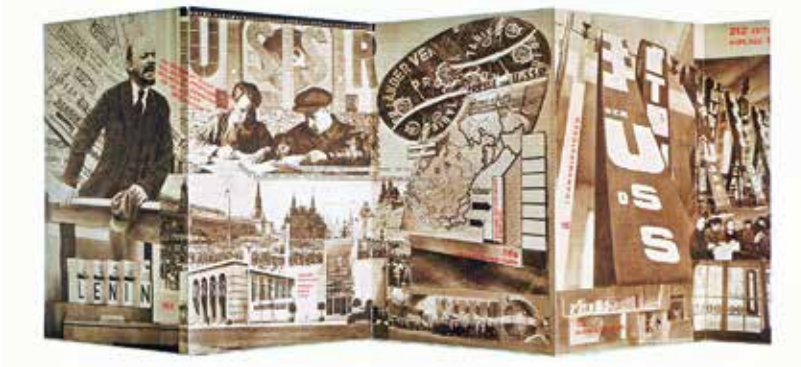
Figura 10. El Lissitzky, detalle del catálogo del Pabellón soviético en la Exposición Internacional de la Prensa (Pressa) de Colonia, 1928. The Getty Research Institute, Los Ángeles / Folkwang Museum, Essen.

En los años siguientes su carrera se irá vinculando mucho más intensamente al diseño gráfico. La revista URSS en construcción se convertirá en uno de sus polos de mayor actividad y su producción derivará hacia un estilo más monumental. Algunos teóricos han reprobado su vinculación al régimen estalinista con esta actividad, en plena época de purgas y persecuciones. En contraposición, Margolín (2015: 90), a pesar de defender la calidad gráfica de sus aportaciones, señala que el número especial de la revista dedicado a la Constitución Soviética, de 1937: “(...) representó el cénit del estilo “narrativo épico” de El Lissitzky: un estilo perfectamente acorde con la retórica del régimen de Stalin, caracterizado por el gesto histórico grandioso y la aglutinación de grandes cantidades de información visual”.