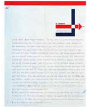
Figura 4. El Lissitzky, Carta a Sophie Küppers , 6 de enero de 1925, The Getty Research Institute, Los Ángeles .

diante fotografías y fotomontajes que impactan al visitante, o con impresionantes estrellas puntiagudas que marcan direcciones espaciales en el aire.