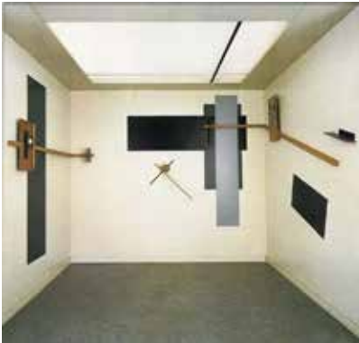
Figura 7. El Lissitzky, Prounenraum o Espacio Proun, 1923, reconstruido en 1971, 320 x 364 x 364 cm. Collection Van Abbemuseum, Eindhoven.