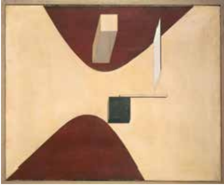
Figura 5. El Lissitzky, Proun P 23 , nº 6, 1919, 52 x 77 cm.