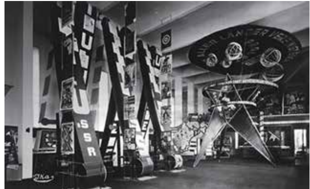
Figura 9. El Lissitzky, Pabellón soviético en la Exposición Internacional de la Prensa (Prensa) en Colonia, en 1928.

to formato de Lissitzky, señalando que: “En un sentido, la exposición era un tipo de libro tridimensional; en otro era una forma de arquitectura con contenido narrativo”.