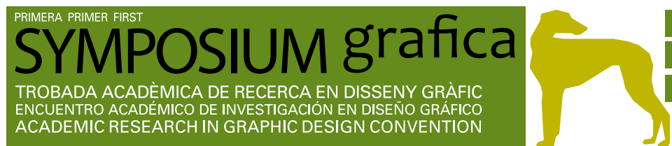
Figura 1. Banner promocional del simposi

Tots aquests temes es veuran publicats en diferents números de la revista, en funció del seu ordre d'entrada al consell editorial. Alguns ja van aparèixer al número 6, i altres ho faran en el present numero.