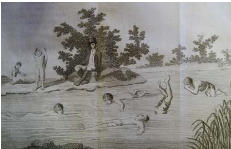
Imagen 3. Lámina La gimnástica o escuela de la juventud (1807)

Uno de los modos de nadar más antiguos y más simples es con las manos juntas, los pulgares y dedos sobre el agua, acercándolos y retirándolos sucesivamente del pecho [...] Se ha de cuidar también de que el movimiento de las manos convenga con el de los pies: acercándolas a la barba, llevándolas en seguida hacia delante formando un semicírculo a izquierda y a derecha, volviendo la palma de la mano hacia fuera. En cuanto a los pies, se acercan muy unidos, luego se extienden sacudiendo el agua a izquierda y derecha. (Amar y Jauffret, 1807, pp. 150-151)