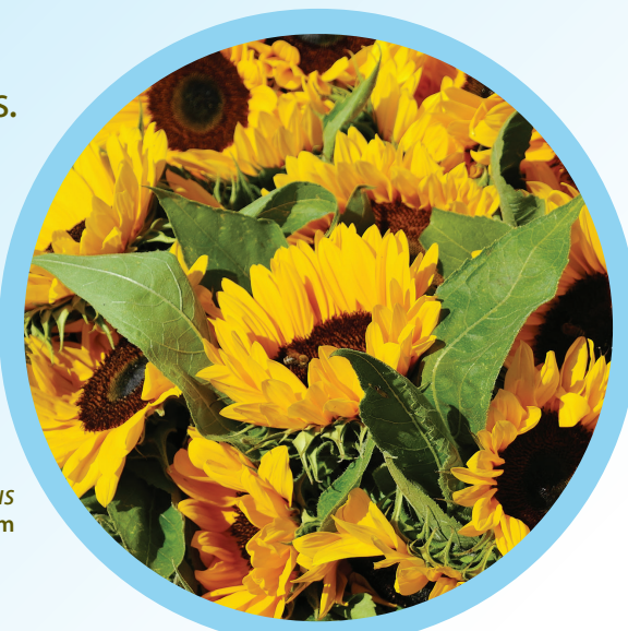
Helianthus annuus

Le cadmium est un métal lourd absorbé par les plantes lorsqu'il se trouve en trop grande concentration dans le sol. D'où son entrée dans la chaîne alimentaire, qui induit des troubles physiologiques. Thlaspi caerulescens est une petite plante utilisée en Europe en extraction de métaux lourds. Des plantes naturalisées ou indigènes telles que Helianthus annuus et Brassica juncea sont d'autres candidates potentielles. Des groupes de six à huit réplicats de chaque espèce ont été exposés à un sol contaminé pendant 39 jours. Par la suite, des tissus cibles ont été digérés à l'acide avant d'être analysés par spectrométrie à émission de plasma d'argon. Les résultats démontrent une différence significative entre la concentration de cadmium trouvée dans les tissus de B. juncea contaminés par rapport aux témoins. Chez H. annuus , la différence a été observée dans les racines plutôt que dans les feuilles. Toutefois, aucune espèce n'a réussi à atteindre la concentration de T. caerulescens , compensant plutôt avec une biomasse plus élevée.