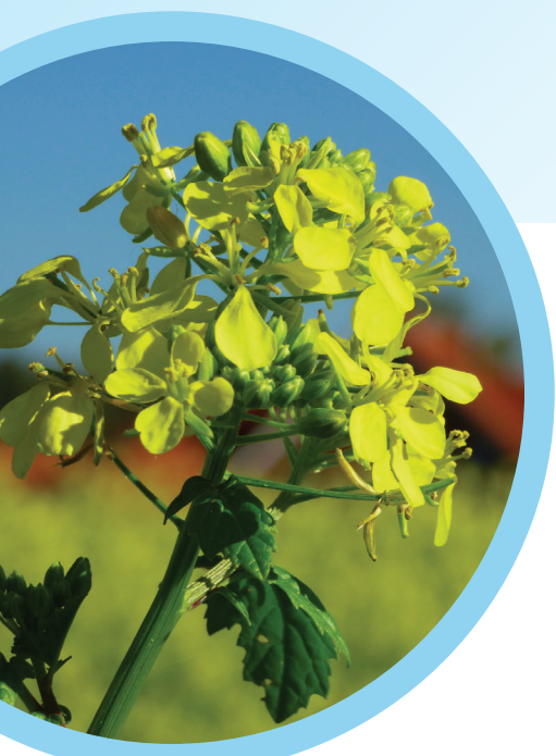
Brassica juncea