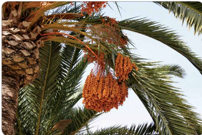
Slika 2. Grana datulje – Phoenix dactylifera L. s listovima i plodovima

Datulja – Phoenix dactylifera L. pripada porodici palmi – Arecaceae (Palmae). Bila je važna ne samo za prehranu, nego i kao simbol pravde, svetosti i uskrснуća u kršćanstvu. Ova biljna vrsta rasprostranjena je u svim tropskim zemljama, a stabljika joj naraste i do 20 m. Njezini su listovi veliki i perasto rascijepani, dok se neugledni cvjetovi razvijaju u gustim cvatovima. Plodovi su vrlo slatke i hranjive koštunice, datulje (slika 2.) (5). Držeći palmine grane u rukama ljudi su pozdravljali Isusa kada je ulazio u Jeruzalem jašući na magarcu. Danas nošenjem palminih grana priznajemo Kristovo vodstvo kroz život i smrt.