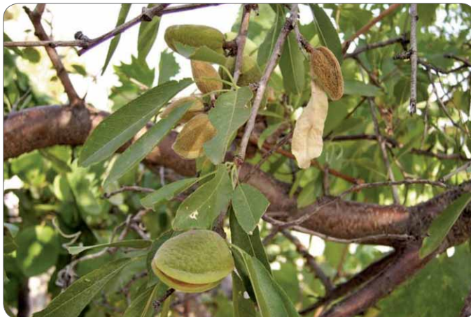
Slika 5. Grane badema – Prunus amygdalus Stokes s listovima i plodovima

Stablo i plodovi badema – Prunus amygdalus Stokes često su spominjani u Bibliji (1). Badem naraste kao dosta visoko drvo. Ima produžene i zašiljene listove pilastog ruba i ružičaste ili bijele cvjetove, koji se javljaju vrlo rano, obično prije listova (2). I