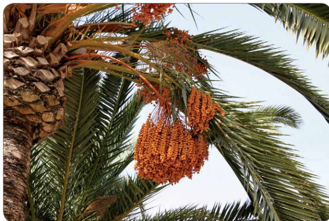
Slika 2. Grana datulje – Phoenix dactylifera L. s listovima i plodovima

Datulja – Phoenix dactylifera L. pripada porodici palmi – Arecaceae (Palmae). Bila je važna ne samo za prehranu, nego i kao simbol pravde, svetosti i uskrснуća u kršćanstvu. Ova biljna vrsta rasprostranjena je u svim tropskim zemljama, a stabljika joj naraste i do 20 m. Njezini su listovi veliki i perasto rascijepani, dok se neugledni cvjetovi razvijaju u gustim cvatovima. Plodovi su vrlo slatke i hranjive koštunice, datulje (slika 2.) (5). Držeći palmine grane u rukama ljudi su pozdravljali Isusa kada je ulazio u Jeruzalem jašući na magarcu. Danas nošenjem palminih grana priznajemo Kristovo vodstvo kroz život i smrt.