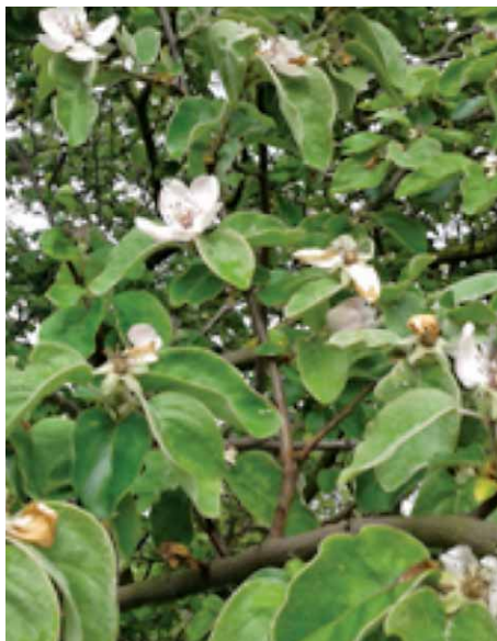
Slika 1. Dunja, Cydonia oblonga Mill.

Iako se list i plod dunje često koriste u tradicionalnoj medicini kod dijareja ponajviše stoga što sadrže velike količine trijeslovina (12–14), nisu navedeni na popisima ljekovitih vrsta svih susjednih područja (2, 4, 5). Također, primjenjuju se izvana kod upale kože i opekline, a u obliku gela ili masti djeluju povoljno u liječenju dekubitusa (13).