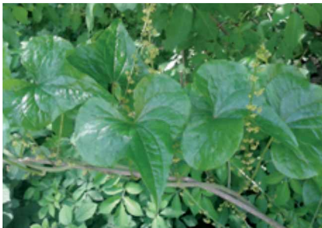
Slika 2. Bljušt, Tamus communis L.

Korijen se iskopa u jesen, očisti, osuši i usitni. Dvije jušne žlice kuhaju se 10 minuta u jednoj litri vode. Namočenom gazom obloži se mjesto zahvaćeno reumom. Korijen se može koristiti i svjež, tako da se nariba i njime obloži bolno mjesto. Oblog se smije ostaviti da djeluje najdulje 10 minuta.