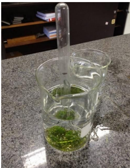
Imagem 1: Experimento do sistema fotossintético montado em béquer com Elodea sp.