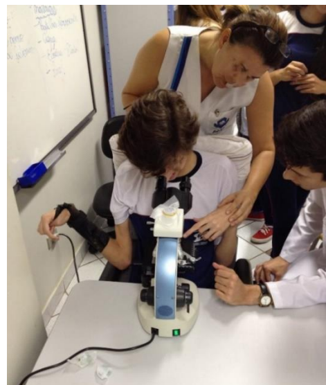
Imagem 2: Aluno de inclusão observando cloroplastos por meio de microscopia óptica.