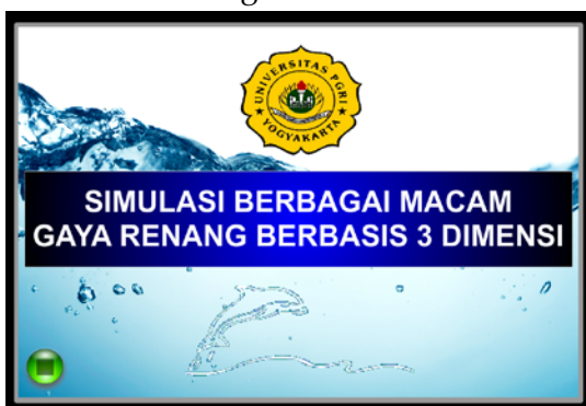
Gambar 3 Halaman intro

Halaman intro merupakan halaman pertama kali yang akan muncul ketika program dijalankan. Pada halaman ini terdapat tulisan Simulasi Berbagai Macam gaya Renang Berbasis 3 Dimensi, logo UPY dan tombol MASUK untuk masuk ke menu utama. Adapun tampilannya terdapat pada Gambar 4.1 sebagai berikut.