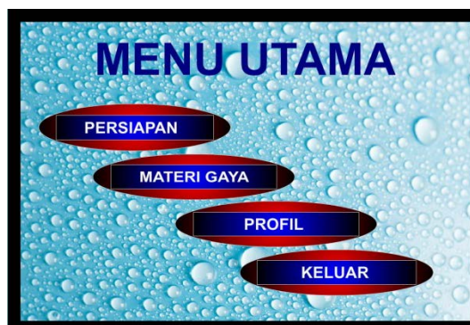
Gambar 4 Halaman Menu Utama

Halaman menu utama merupakan halaman induk dimana terdapat menu atau tombol untuk menuju ke halaman seperti : (1) Tombol Simulasi 3D untuk menuju ke halaman Menu Simulasi 3D, (2) Tombol profil untuk menuju ke halaman profil atau biodata penulis, (3) Tombol keluar untuk keluar dari program. Adapun tampilannya terdapat pada Gambar 4.2 sebagai berikut.