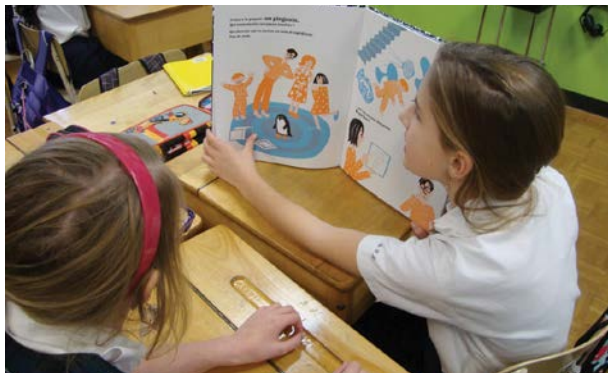
Fig. 3 - Une lecture en tandem de l'album 365 pingouins .

la sélection d'œuvres littéraires tout en retenant 10 œuvres incontournables pour lier littérature et mathématiques au primaire. Loïc Fauteux-Goulet, enseignant au primaire, et Martin Lépine tissent ensuite un réseau autour des 365 pingouins tout en exposant une démarche interdisciplinaire réalisée en classe (pour un aperçu, voir la figure 3).