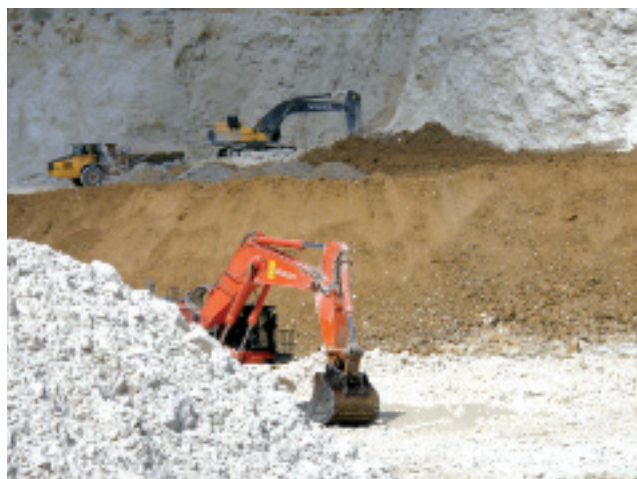
Rys. 2 Wydobywanie surowca w kamieniołomach położonych koło Cementowni Warta S.A.

Globalizacja powoduje wydłużenie drogi od producenta do konsumenta i zwiększa ryzyko wprowadzania na rynek nieoryginalnych produktów. Jest to poważny problem przede wszystkim dla konsumentów, ponieważ kupując towar tylko podobny do oryginalnego, często o gorszej jakości. Należy podkreślić, że z fałszowaniem wyrobów alkoholowych ludzkość boryka się od starożytności, kiedy to podrabiano