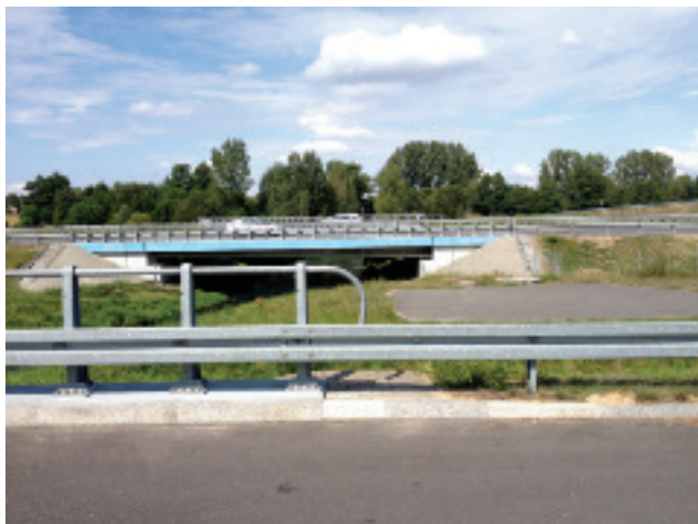
Rys.4. Bzura w pobliżu autostrady A2

gleby, jak na przykład działalność rolnicza człowieka lub za pośrednictwem powietrza (np. spaliny samochodowe, pyły, sadze przenoszone znad szlaków komunikacyjnych), czy wody (oczyszczalnie ścieków).