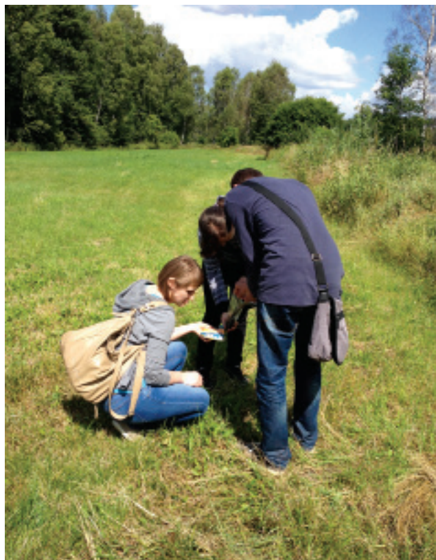
Rys. 2. Pobór próbki gleby

łączy on zagadnienia z zakresu analizy chemicznej i ochrony środowiska. Tereny zalewowe rzeki Bzury są interesującym obszarem badań, ponieważ rzeka ta pełniła niegdyś ważną rolę gospodarczą, o czym świadczą znajdujące się nad rzeką młyny wodne oraz zbiorniki retencyjne. Dodatkowo wzdłuż rzeki zlokalizowane były zakłady przemysłowe, czego przykładem może być Zakład Przemysłu Barwników Boruta , który odprowadzał ścieki bezpośrednio do rzeki. Bzura, wylewając w wyniku dużych opadów, bądź w okresie spływu wód wiosennych, powodowała użyźnienie łąk terasy zalewowej. Jednocześnie niesione przez wody rzeki zanieczyszczenia, zwłaszcza metale ciężkie, ulegały akumulacji w glebach doliny [3].