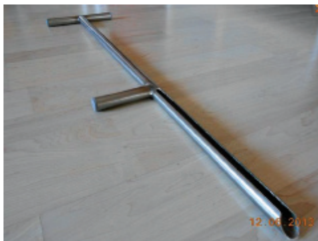
Rys. 3. Laska glebowa

Substancje organiczne zawarte w glebie wpływają na szereg jej właściwości, które z kolei decydują o jej żyzności [4].