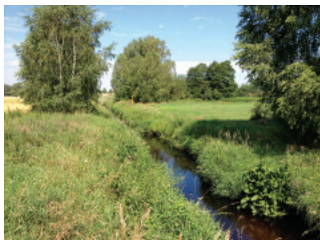
Rys. 1. Bzura

W trakcie naszych studiów mieliśmy okazję wziąć udział w projekcie dotyczącym badania stanu środowiska glebowego na obszarach zalewowych dorzecza Bzury. Projekt ten wydał nam się niezwykle ciekawy ze względu na to, że